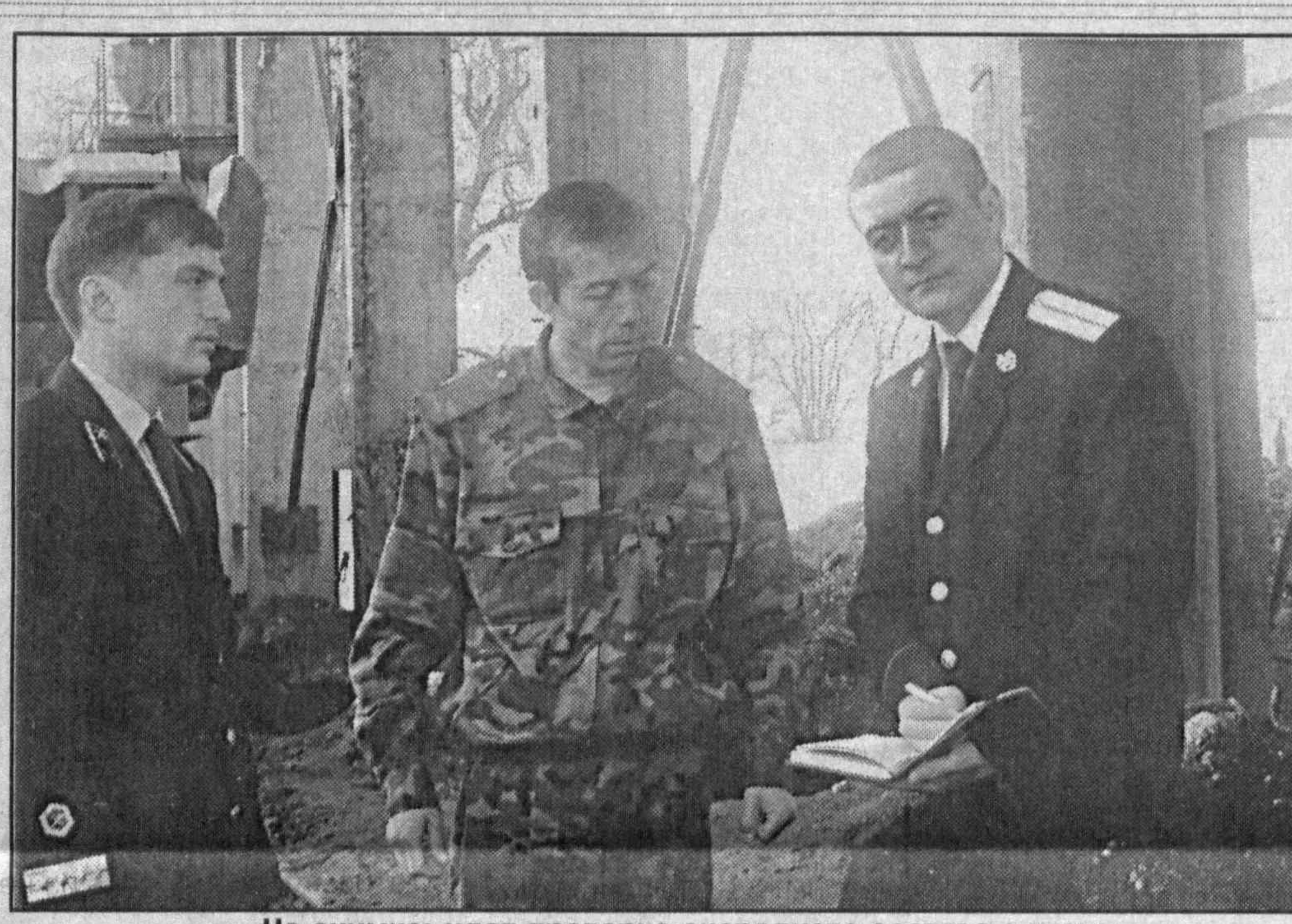
На снимке: идет проверка очередного состава с углем.

Флагман угольной отрасли «Ангренский угольный разрез» в минувшем году к итоговому показателю добывал один миллион тонн продукции, что стало возможным, в том числе, и благодаря активной работе Ташкентской транспортной прокуратуры и линейного пункта милиции на станции Ангрен. Дело в том, что минувшая холодная и снежная зима в известной степени «спровоцировала» случаи хищений угля, но уже по состоянию на 1 февраля подобная «практика» полностью была исключена. Рекламаций на недогруз со стороны потребителей нет. Марат НАСЫРОВ, Ангрен.