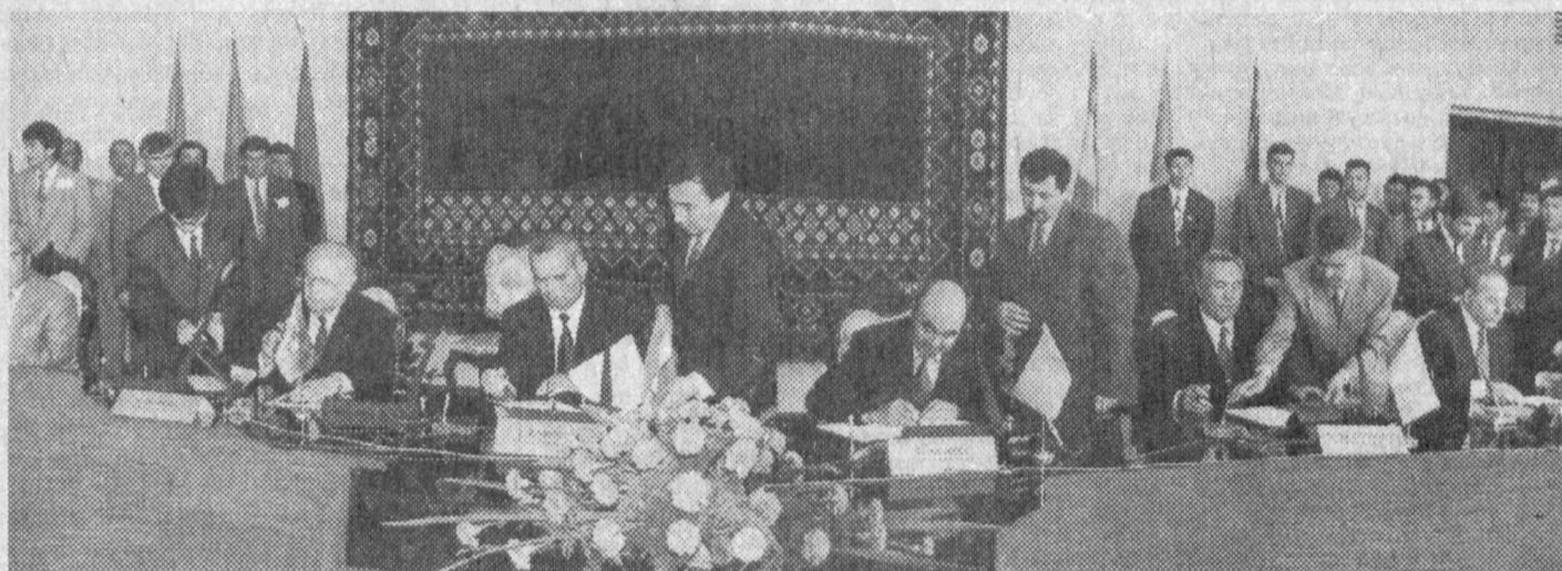
СУРАТДА: ҳужжатлар имзоланаётган пайт.

Асримизнинг охириги ўн йиллиги жаҳон харитасида катта ўзгаришлар ясади. Марказий Осиё республикаларининг мустақилликка эришиши натижа-сида туркий дунёда юз берган янгиликни маънавий тилда сўзлашувчи халқларнинг маданий-маънавий жиҳатдан жипслаши-шини тақозо қилди. Зеро, ми-нг йиллар давомида бир ил-диздан баҳра олган халқлари-миз орасига қўйилган сунъий тўсиқ барҳам топди. Тарихни, ўзлигини англаш мавриди кел-ди. Туркий тилли давлатлар раҳбарларининг илгари Анка-ра ва Истанбулда ўтган олий даражадаги учрашувлари, Ан-кара баённомаси ҳамда Истан-бул декларацияси ана шу мақ-садни амалга ошириш, халқ-ларимиз ўртасидаги дўстлик ва ҳамкорликни, маънавий уйғун-ликни мустаҳкамлаш йўлида муҳим қадам бўлган эди.