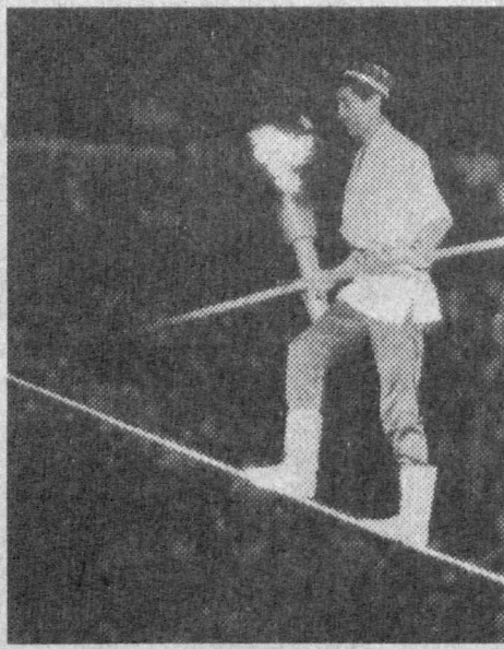
ри борасида маълумот бериб ўтсангиз, деб гап орасида қўйд...