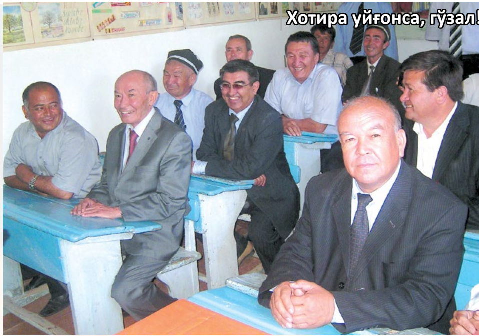
Хотира уйғонса, гўзал!