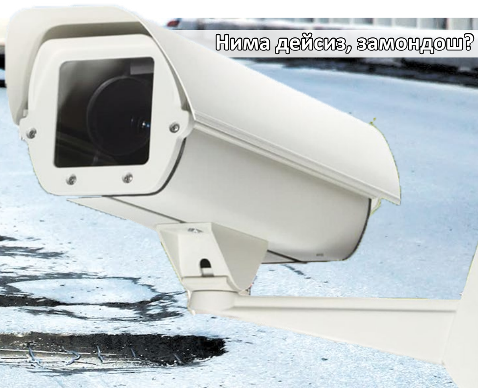
Нима дейсиз, замондош?