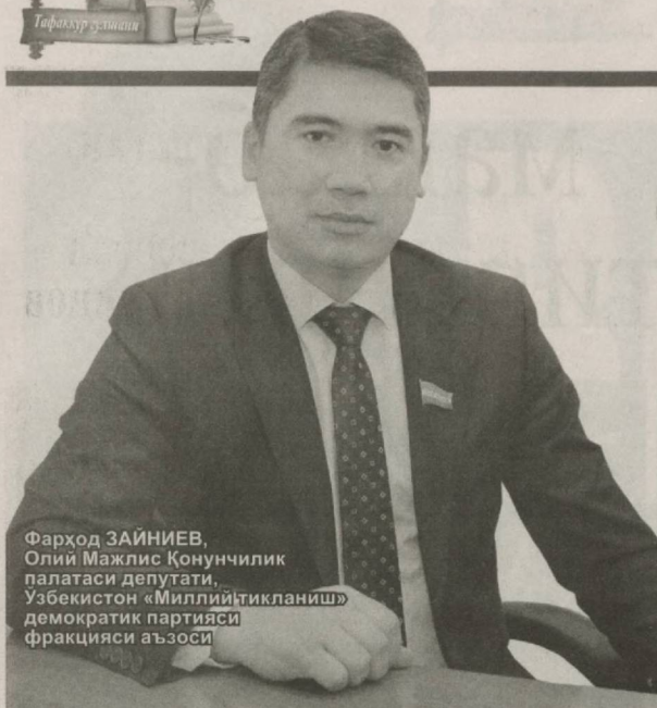
Фарход ЗАЙНИЕВ, Олий Мажлис Қонунчилик палатаси депутаты, Ўзбекистон «Миллий тикланиш» демократик партияси фракцияси аъзоси