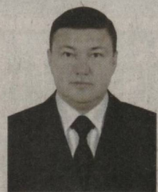
Мурод ҚУРБАНОВ, Қорақалпоғистон Республикаси Соғлиқни сақлаш вазир

Бугунги туб ўзгаришлар даврида бошқа соҳалар қатори соғлиқни сақлашда ҳам изчил ислоҳотлар олиб борилмоқда. Айниқса, аҳолига кўрсатилаётган бирламчи тез тиббий ёрдам, ихтисослаштирилган хизматлар сифатини яхшилаш, тиббиёт муассасаларини арзон, аммо сифатли дори-дармон ва тиббий буюмлар билан таъминлаш ҳамда хусусий тиббиётни ривожлантириш борасидаги ишлар шулар жумласидандир. Айни пайтда Қорақалпоғистон Республикасининг 1,9 миллиондан зиёд аҳолисига 38 та стационар (шундан 22 та республика, 17 та шаҳар ва туманлар таркибидаги тиббий муассаса, 6 та диспансер ва 12 та марказ) ва 146 та амбулатория-поликлиника шифохоналари томонидан тиббий хизмат кўрсатиляпти. Шунингдек, 35 та қишлоқ врачлик пункти, 69 та қишлоқ ва 9 та шаҳар оилавий поликлиникаси, 17 та кўп тармоқли марказий поликлиника, 1 та шаҳар, 16 та туман тиббиёт бирлашмаси ҳамда марказий шифохоналар таркибидаги 16 та тез тиббий ёрдам бўлимларида 4 минг 305 нафар шифокор, 18 минг нафарга яқин урта бўғин тиббиёт ходими фаолият олиб бормоқда.