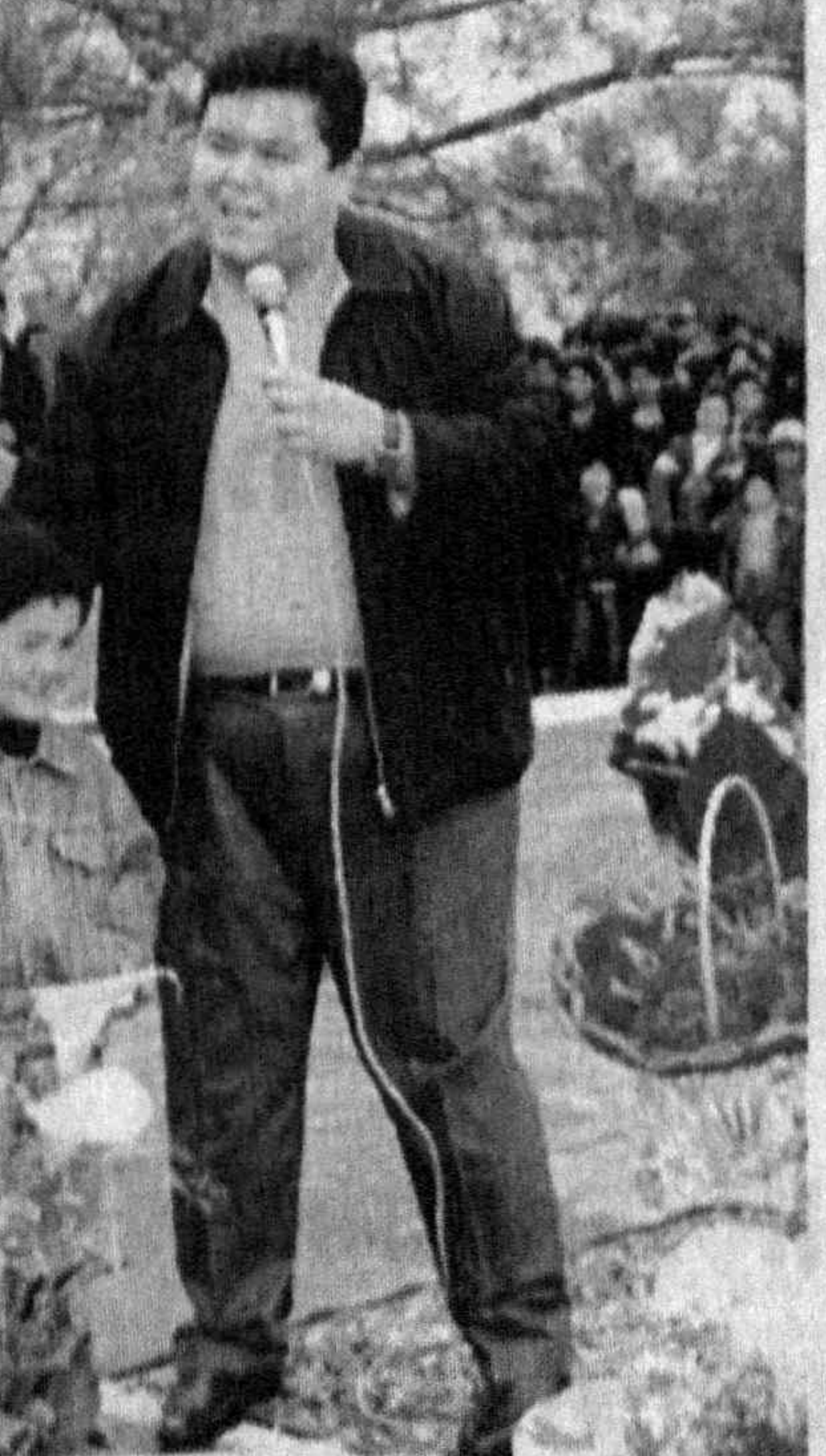
На снимках: так весело проходил праздник в Ташкентском районе.

Сегодня узбекистанцы в едином порыве реализуют широкомасштабные национальные программы обновления социально-экономической и культурно-духовной жизни страны.