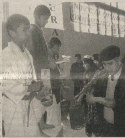
Ўзбекистон келажаги, бўлажак полвонлари, метин қалқонлари дир. Бундай иқтидорли болаларни топиш, қўллаб-қувватлаш ҳам биримизнинг бурчимиз. Тадбир сўнггида иштирокчилар фикри билан қизиқдик.