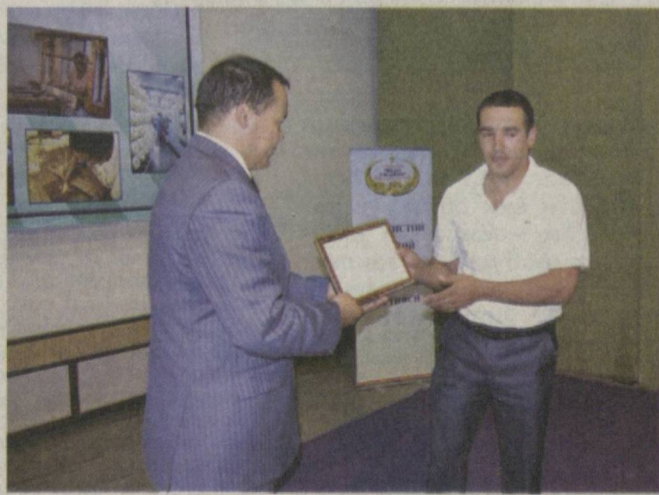
Таъкидланганидек, юртимизда истиқлол йилларида халқимизнинг маънавий қадриятлари, урф-одат ва аъёналари, бой тарихий ме-

Чуст туманида Ўзбекистон "Миллий тикланиш" демократик партияси Марказий Кенгаши, Олий Мажлис Қонунчилик палатасидаги фракцияси, Ўзбекистон Республикаси Марказий банки ва Республика "Хунарманд" уюшмаси ҳамкорлигида "Банк кредитларининг оилавий тадбиркорлик ва миллий хунармандчиликни ривожлантиришидаги аҳамияти" мавзусида семинар ўтказилди.