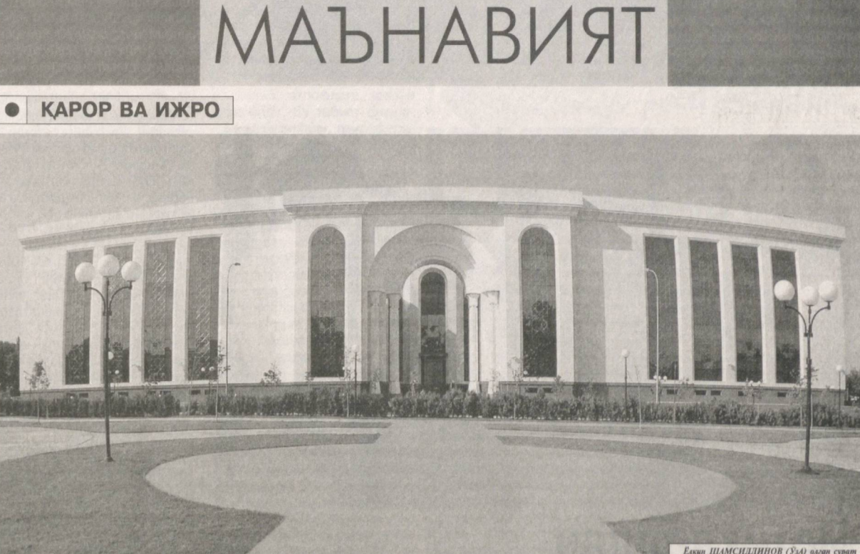
Ёқуб ШАМСИДДИНОВ (ЎЗА) пайди сурат