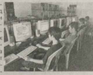
Хорижий ОАВ хабарлари асосида тайёрланди

Тайванда 40 соат интернетда ўйин ўйнаган 18 ёшли ўспирин оламдан ўтган. Мутахассисларнинг компьютер қаршида ҳаддан зиёд кўп ўтириш соғлиқ учун хавфли экани ва инсон руҳиятига салбий таъсир кўрсатиши борасида фикрлари тайванлик ўспирин мисолида яна бир марта намоён бўлди. Хабарларга кўра, Чуанг исми бу йигит ўйинга шу қадар берилиб кетганки, ҳатто овқатлини, ухлагани ҳам унутган. Оқибатда 40 соатлик бетўхтов ўйиндан сўнг ҳушини йўқотган. Шифохонага келтирилган Чуанг кўп ўтмай ҳаётдан қўз юмган. Мутахассисларнинг фикрича, бу борада меъёрни сақлашни назорат қилиш муҳим аҳамиятга эга.