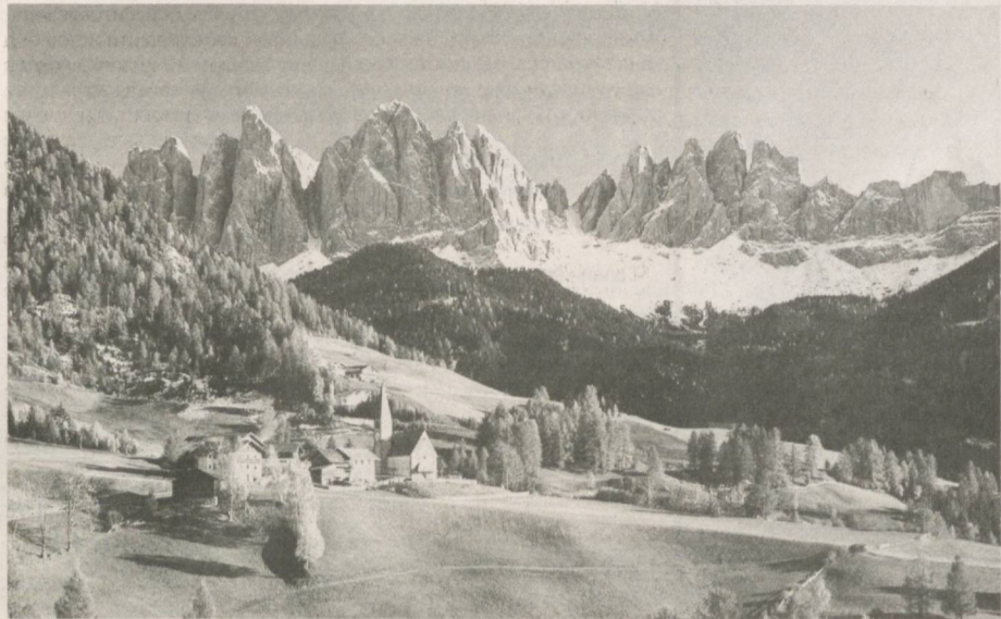
Европа сайёрамиздаги энг катта қитъалардан бири бўлиб, ҳудуднинг аксарият қисми ўртача кенгликларда жойлашган. Бу ерда Арктика, субарктика, мўътадил ва субтропик иқлим ҳукмрон. Глобал иқлим ўзгариши оқибатида, бошқача айтганда, инсоният томонидан табиатни забт этишига қаратилган хатти-ҳаракатлар минтақани ҳам четлаб ўтмади.

ЕВРОПАДАГИ АЙРИМ ДАВЛАТЛАР ИҚЛИМ ЎЗГАРИБ, МУЗЛИКЛАР ЭРИЁТГАНИ ТУФАЙЛИ ЧЕГАРАЛАРНИ ҚАЙТА КЎРИБ ЧИҚМОҚДА