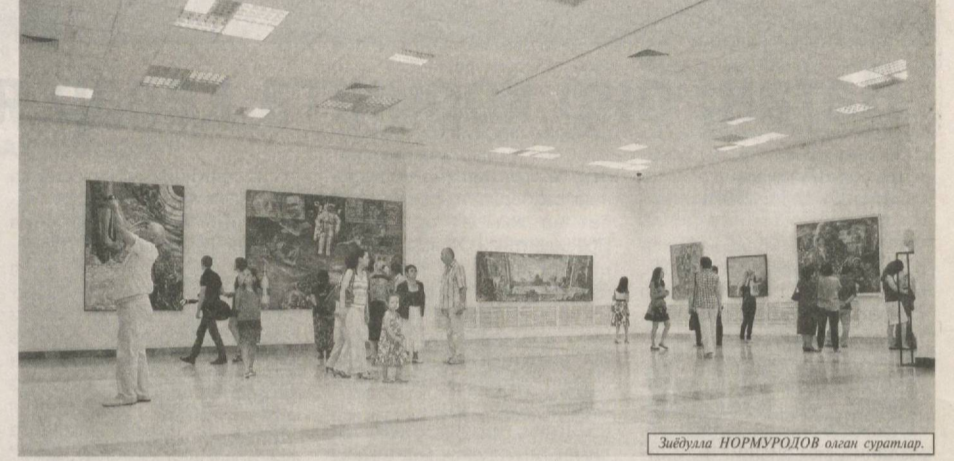
Забдулла НОРМУРДОВ оingan суратлар.

Ўзбекистон Бадий академиясининг марказий кўргазмалар залида бадий кўргазмалар дирекцияси фондида, шунингдек, муаллифлик ва шахсий тўпламларда сақланаётган рангтасвир ва ҳайкалтарошлик асарларининг перспектив намойиши ана шундай эзгу мақсад йўлида хизмат қилиши шубҳасиз. "Бизнинг мерос" туркумига кирувчи ушбу кўргазма энг сўнггиси бўлиб, Ўзбекистон Бадий академиясининг ташкил топганига 15 йил тўлиши муносабати билан ўтказилмоқда. Қолаверса, кўргазманинг муқаддас рамозон ойига тўғри келиши ҳозирда орамизда йўқ рассомларни яна бир бор хотирлаш, уларнинг ижод маъ-