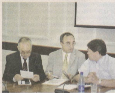
КОНЦЕПЦИЯДА билдирилган сайлов қонунчилиги оид тақлифлар, аввало, партиаларро рақобатнинг кучайиши, сайловолди ташвиқотнинг шакл ва усуллари турли-туман ва кенг миқёсга эга бўлишига олиб келади.