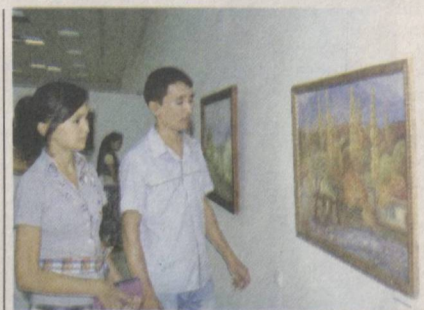
КЎРГАЗМАГА қўйилган асарлар орасида юртимиз табиатида хос манзаралар, миллий қадриятларимиз акс этган асарлар, ижодкорларнинг ҳаёт йўли, ижодидаги танлаган мавзулари қизиқшимизнинг янада орттишига сабаб бўлди.