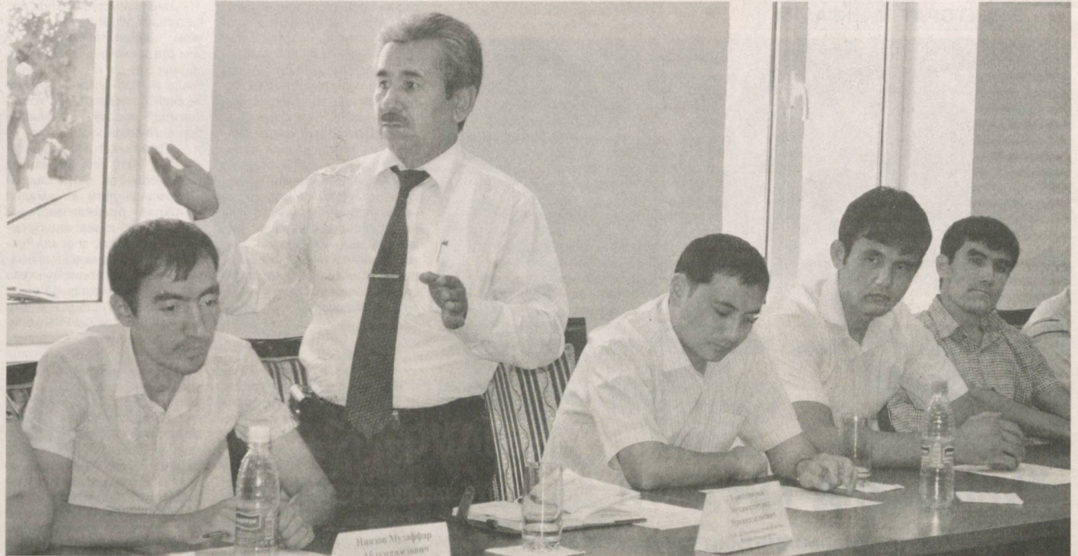
Партия тадбиридан лавҳа

Илмий-амалий конференция якунида мамлакатимизда сиёсий модернизация жараёнларида замонавий ахборот-коммуникация технологияларидан кенг қўламда фойдаланишни таъминлаш юзасидан тегишли тавсиялар ишлаб чиқилди.