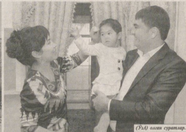
(ЎзА) оилангиз суратлар.