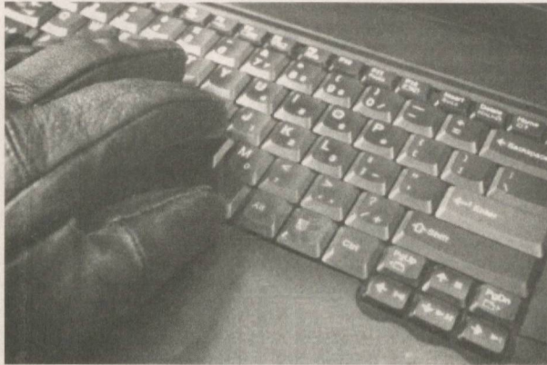
Дунёда ҳатто энг яхши ҳимояланган йирик компания ва корпорациялар кибер-жиноятчилик ортидан ҳар йили 1 триллион долларга яқин зарар кўрмоқда.

УЛАР СОХТА ЭЛЕКТРОН МАНЗИЛЛАР, ЯСАМА ВЕБСАЙТЛАР, ТУРЛИ ВИРУСЛАР ВА ТАРМОҚЛИ РЕКЛАМАЛАР ОРТИГА ЯШИРИНГАН