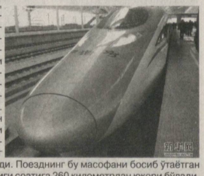
Хорижий ОАВ хабарлари асосида тайёрланди

Хабарларга кўра, хитойлик темирйўлчилар Пекин билан Шанхай ўртасида қатнайдиغان тезорар поезднинг илк синовини ўтказишди. Икки шахар ўртасидаги масофа қарийб 1300 километрли ташкил этилди. Эндиликда Пекиндан Шанхайга бормоқчи бўлган йўловчи 5 соатдан кейин ўзининг манзилига етиб боради. Поездининг бу масофани босиб ўтаётган пайтдаги ўртача тезлиги соатига 260 километрдан юқори бўлади.