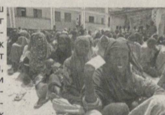
Хорижий ОАВ хабарлари асосида тайёрланди

Сомалида мисли кўрилмаган қаҳатчилик, касалликлар тарқалмоқда. Жаҳон Соғлиқни сақлаш ташкилотига кўра, Сомалининг яна бешта вилояти очарчиликка юз тутмоқда. Қурғоқчилик ва зўравонликлардан азият чекаётган 3.7 миллион одам, яъни Сомали аҳолисининг ярми тезкор инсонпарварлик ёрдамига муҳтож, шунингдек, буғунги кунда 780 минг гўдак ҳаёти хавф остида. Ҳозир 166 мингдан ортиқ сомалиликлар қўшни Кения ва Эфиопияга қочиб ўтган. "Ал-Қоида" террорчилик гуруҳи билан алоқадор кўрилган "Ал-Шабаб" гуруҳи мамлакатнинг катта қисмини назорат қилади. Бу эса халқроқ ёрдам ташкилотлари фаолиятига жиддий таъсир кўрсатмоқда.