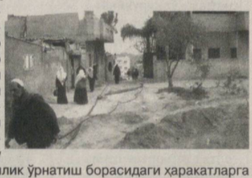
Хорижий ОАВ хабарлари асосида тайёрланди

АҚШ Исроилни янги турар-жойлар қурилишини тўхтатишга чақирган. АҚШ Исроил ҳукумати Иордан дарёси Фарбий соҳилида яхудиёлар учун янги турар-жойлар қуришга рухсат бериш тўғрисидаги қарорини қоралади. Давлат департаменти вакили Викториа Нуланднинг фикрича, Исроил ҳукуматининг бу қарори Яқин Шарқда тинчлик ўрнатиш борасидаги ҳаракатларга таъсир қилади. Исроил Мудофаа вазирлиги аввалроқ Ариэл Аҳоли пунктида 300 та уй қуришга рухсат бергани тўғрисида баёнот берганди. Фаластинликлар тинчлик музокараларини қайта тиклашнинг шартларидан бири сифатида Фарбий соҳилдаги яхудиёлар яшайдиган пунктларда қурилишни тўла тўхтатишни талаб қилмоқда.