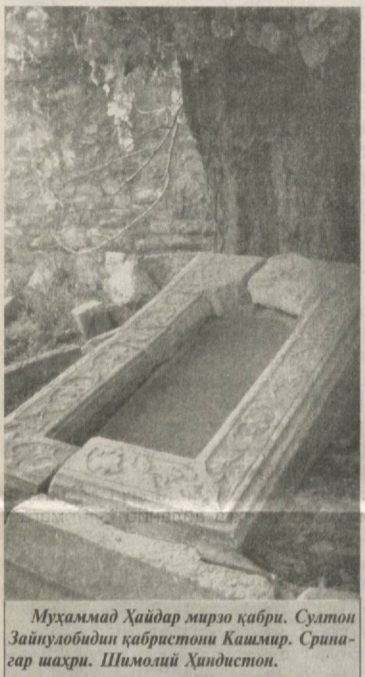
Мухаммад Хайдар мирзо қабри. Султон Зайнулобидин қабристонини Кашмир, Сринагар шаҳри. Шимолий Ҳиндистон.