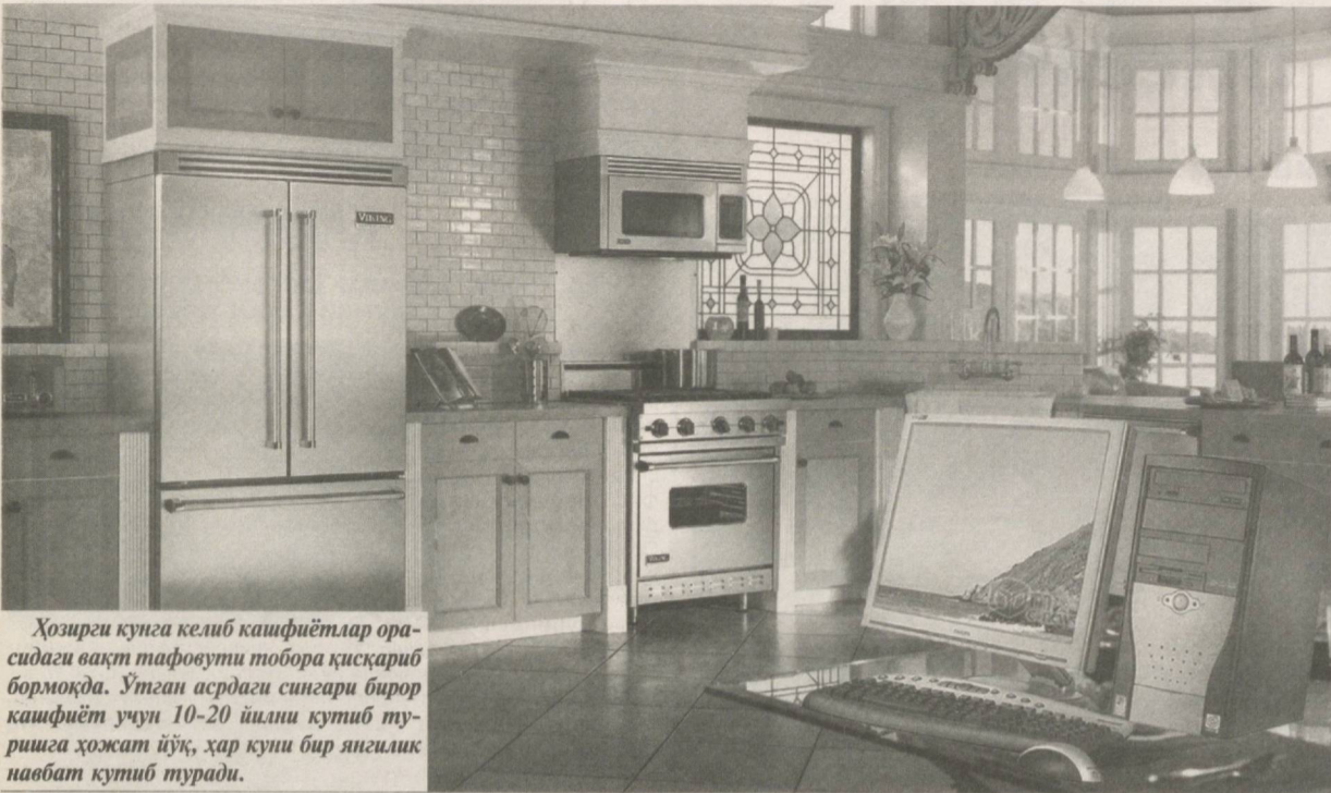
Ҳозирги кунга келиб кашфиётлар орасидаги вақт тафовути тобора қисқариб бормоқда. Утган асрдаги сингари бирор кашфиёт учун 10-20 йилни кутиб туришга ҳоҷат йўқ, ҳар куни бир янгилик навбат кутиб туради.

та плазали DPX-14 компьютери мультимедиа ахборотини, жумладан, экранда жуда юқори аниқлик билан тасвир ҳосил қилувчи видео билан ишлайди ва атиги 5 вт. энергия истеъмол қилади.