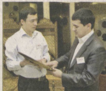
"ЎЗБЕКИСТОН маданияти ва санъати форуми" жамғармасининг ёрқин лойиҳаларидан бири бўлган "Bazar — Art" кўرғазма-ярмаркасининг қаморови ва иштирокчилари сони йилдан-йилга кўпайиб бормоқда.