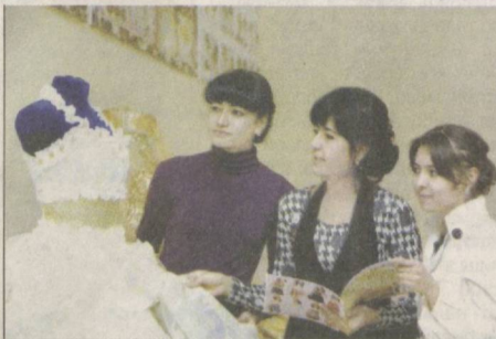
ТОШКЕНТ шаҳридаги "Машхура" ўқув марказининг Қарши филиали 2006 йилдан буюн фаолият кўрсатиб келмоқда. Бугунги кунгача ушбу марказда 15 мингдан зиёд хотин-қиз қандолатчилик, бичиш-тиқиш, парда тиқиш, компьютер сабоқлари, тўқиш, сартарошлик, уй ҳамшираси каби курсларни муваффақиятли тамомлади.