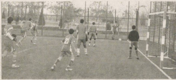
(Давоми. Бош 1-бетда)

“МИЛЛИЙ ТИКЛАНИШ” ГАЗЕТАСИ СОВРИНИ УЧУН БЕЛЛАШДИЛАР