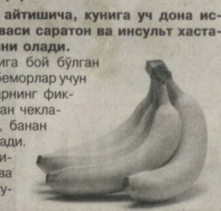
Хорижий ОАВ хабарлари асосида тайёрланди

Шунингдек, калий моддасига бой бўлган ушбу мева қон босими юқори беморлар учун ҳам фойдалидир. Диетологларнинг фикрича, инсон фақат банан билан чекланиб қолмаслиги лозим. Зеро, банан калорияга бой мева ҳисобланади. Уларнинг айтишича, банан ўрнини исмамоқ, ёнғоқ, сўт, балик ва ясиқ каби ўсимлик ва маҳсулотлар босиши мумкин.