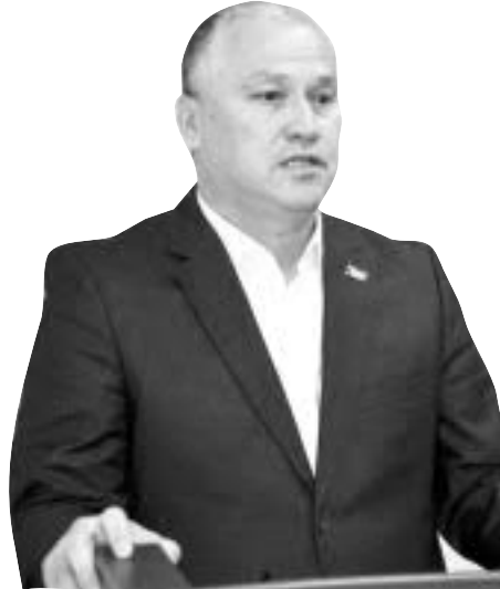
Олим РАВШАНОВ, Ўзбекистон ХДП Қашқадарё вилоят кенгаши раиси, халқ депутатлари вилоят Кенгашидаги партия гуруҳи раҳбари:

ВИЛОЯТ ФАОЛЛАРИ БИЛАН ЎТКАЗИЛГАН ЙИҒИЛИШДА ХАЛҚ ДЕМОКРАТИК ПАРТИЯСИ ДЕПУТАТЛАРИ ВА ФАОЛЛАРИ ҲАМ ҚАТНАШДИ. БИЛДИРИЛГАН ФИКРЛАР, БЕЛГИЛАНГАН ВАЗИФАЛАР ҲАҚИДА ЎЗ ФИКР ҲАМДА ХУЛОСАЛАРИНИ МУХБИРИМИЗ БИЛАН БЎЛИШДИ.