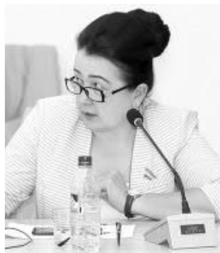
Дилором ИМОМОВА, Олий Мажлис Қонунчилик палатаси депутаты:

Бу ишларда биз – нуронийлар маҳалламизга бош-қош бўламыз. Вақтимизни чойхоналарда, нардаю карта ўйнаб, беҳудага сарф этиш ўрнига, фарзандларимизга насихат, ўрнак кўрсатишга сарфласак, айни мудоао бўлади.