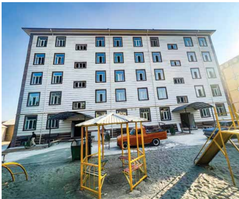
Тўрақўрғон туманидаги кўп қаватли уй

Инсоннинг фаровон турмушини унинг маънавияти ва маданиятисиз тасаввур қилиш мушкул, аниқроғи, мумкин эмас. Тумандаги 105 гектар майдонни эгаллаган Чағир маҳалласида 866 та оилада 2813 нафар аҳоли истиқомат қилади. Худуддаги 300 ўринли маданият маркази биноси анчадан буён таъмирталб аҳволда эди. Унинг янгича қиёфага кириши учун оз эмас кўп эмас нақ 2 миллиард 711 миллион сўм маблағ республика бюджетидан ажратилди. “Уста Нўрмои” хусусий корхонаси қурувчилари астойдил энг шимариб, меҳнат қилишди.