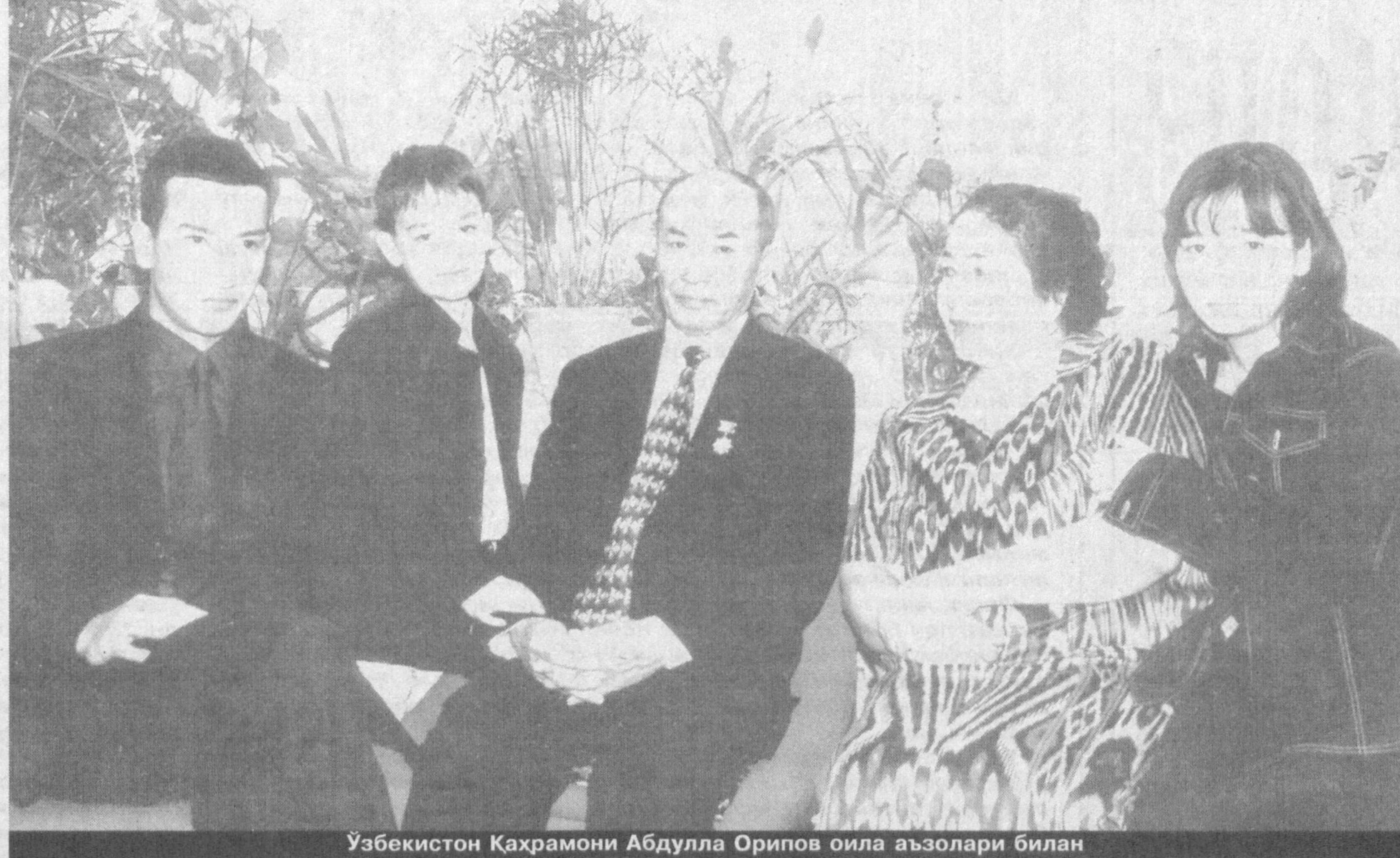
Ўзбекистон Қаҳрамони Абдулла Орипов оила аъзолари билан

Эллигинчи йилларнинг адоғида «Ватан» кинотеатрида рус кинорежиссёри Г. Козинцевнинг кино асари — «Ҳамлет» фильми намойиш этиламоқда эди. Уша кунларнинг бирида томошабинлар орасида таниқли шоирлардан бирини учратиб қолдим. У кутилмаганда, ушбу филмдан олган ҳайратини эмас, балки 30-йилларда Ҳамза номидаги театр сахнасида кўйилган «Ҳамлет»дан сўз очиб, «Маннон Уйғур Шекспирнинг бу ўлмас асарини ўша пайтдаёқ тўғри идрок ва тақдир этган экан» деб машҳур спектакл ҳақида тўқиниланиб сўзлай кетди. Кейин, яна шундай кутилмаган бир ҳолатда, Абдулла Орипов деган ёш шоирни кашф этганини ва унинг ўзига кўшни бўлиб яшаётганини айтди. Хуллас, ўша куними ё эртасигами у киши мени уйига бошлаб бориб, «Нақ Усмон Носирнинг ўзи» дегани Абдулла Ориповни қақиртириб келди. Ёш шоир тонгга қадав шеър ўқиди, ўқиганда ҳам ҳамма шёърларини ёдан ўқиди. Бу, 50-йиллар шеърятига асло ўхшамаган, шу шеърят ичидан гўё олов бўлиб чиқиб, кўкка ўрлаган ва теварак-атрофга турфа мушак қиличлари ўлароқ отилиб, ҳаммаёқни — зимистон кечани нурафшон этиб юборган шеърлар эди.