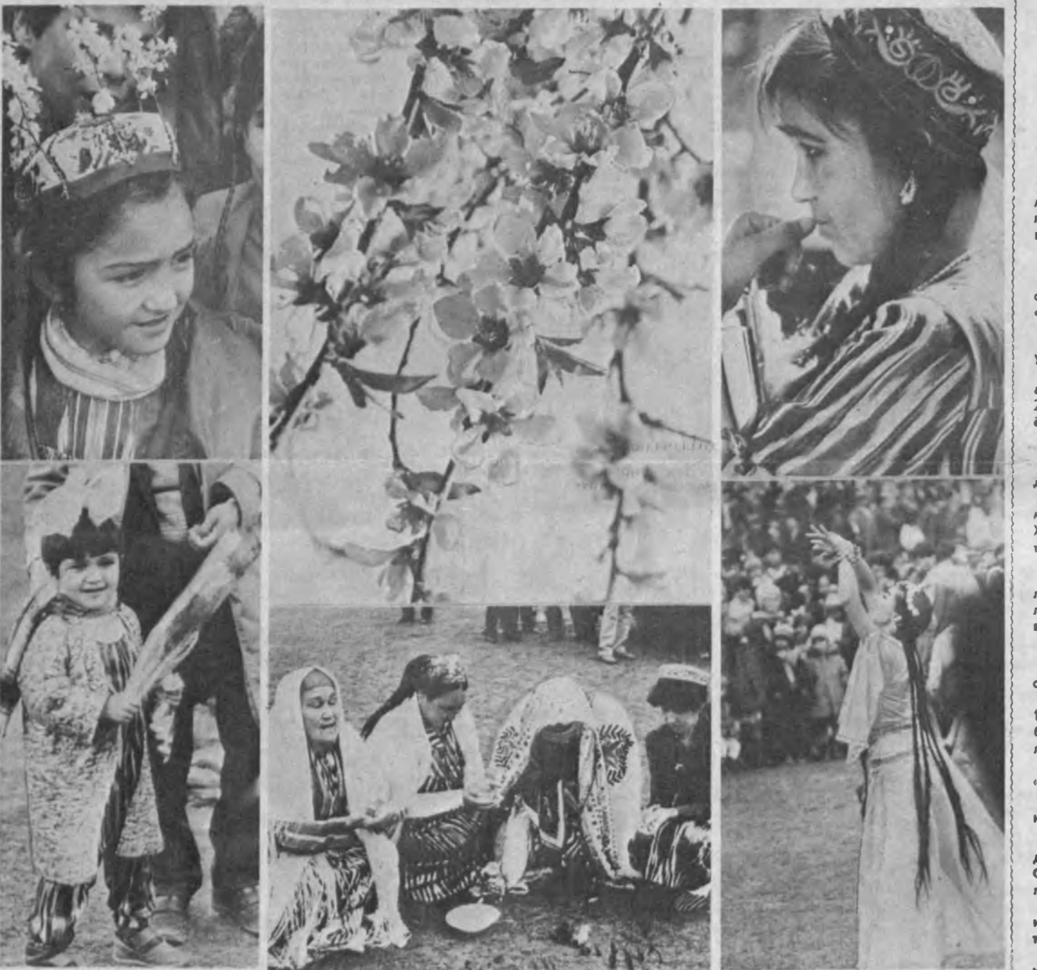
Мана бутун Наврўзи олам, дўстларинга гуллар тутарман...

беморларга байрам таомларидан олиб бориб берадилар;