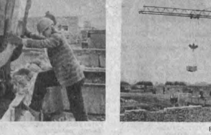
Е. БОТИР олган суратлар.