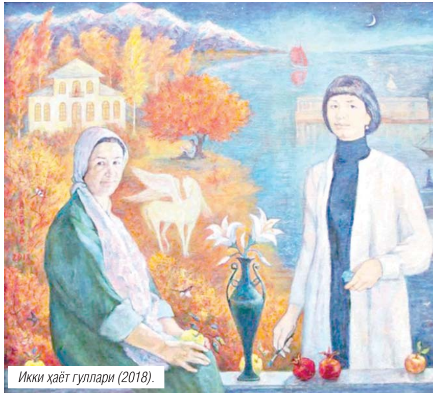
Икки ҳаёт гуллари (2018).

– Академиядаги таълим жараёни ўзгача кечган бўлса керак? – Рус тилини яхши билганим учун кўп дўстлар орттирдим. Яхшироқ ўрганишга ҳаракат қилиб, тажрибали куредошим чизса ёнида туриб, уни кузатиб ишлардим. Академияда ўқиш қийин, лекин кизиқарли бўлган. Кўпроқ Эрмитаж