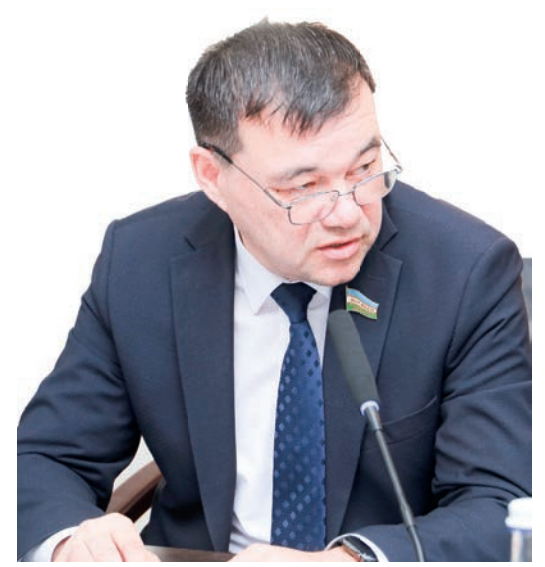
Зафар ХУДОЙБЕРДИЕВ, Олий Мажлис Қонунчилик палатаси депутати, О'zLiDeP фракцияси аъзоси:

Айтишимиз жоиз, юртимизда сиёсий тизим янги-янгилантириш. Биз мана шу ишларнинг, ислохотларнинг мазмун-моҳиятини сайловчиларимизга содда ва раvon тилда етказишимиз керак.