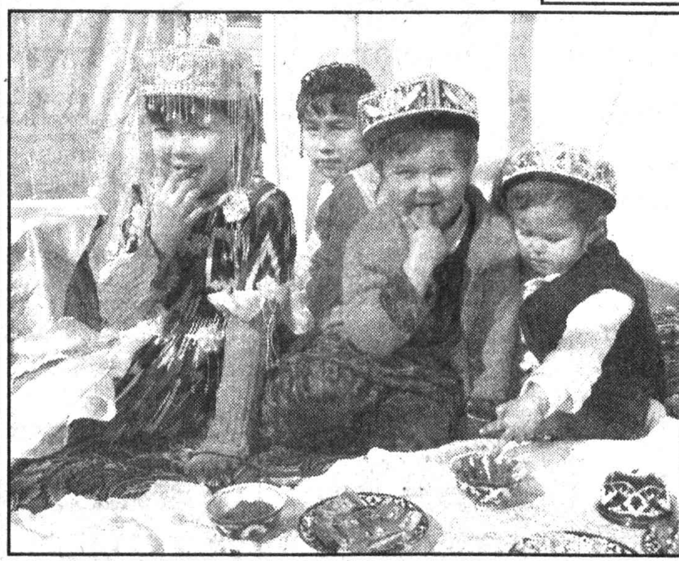
Весна. Пробуждается природа, оживают сады. А дети - цветы нашей жизни - красивы и непосредственны в любое время года.