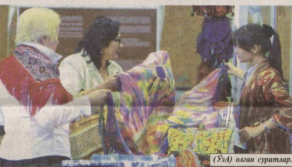
(ЎА) олган суратлар.

— Ўзбекистонга биринчи бор келишим. Юртингизнинг бой тарихини акс эттирувчи ноёб ёдгорликлар, қадимий шаҳарлари ҳақида кўп эшитганман. Мана энди уларни ўз кўзим билан кўриш шарафига муяссар бўлдим. Улар асраб-авайлангани, яши сақланаётгани, тарих, бой маданият, урф-одатларингиз келажак авлодга етказиб берилаётгани ҳар қанча эътироф ва таҳсинга лойиқ. Самарқанд,