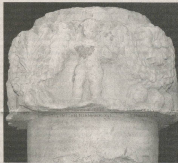
Дунётепа ибодатхонаси худудидан топилган устуннинг тепа қисми (I-II асрлар). Мазкур санъат асариди Юнон-Бақтрия ва Кушон даври, уларнинг рамзлари акс эттирилган.

Одамлар сингари, шаҳарларнинг ҳам ўзига хос тақдир, ҳаёт ва кураш йўли, яхши-ёмон кунлари, ютуқ ва мағлубиятлари бўлади. Шаҳарлар ҳам одамлардай аста-секин оёққа туради, турмуш тарзи, қиёфаси, урф-одатлари, расм-русумлари шаклланади, улғайиш, калмога етишининг турли босқичларидан ўтади, одамлар каби умри давомида турли синновларга, ногаҳоний зарбаларга дуч келади, оғир йўқолишлар азобини тартади.