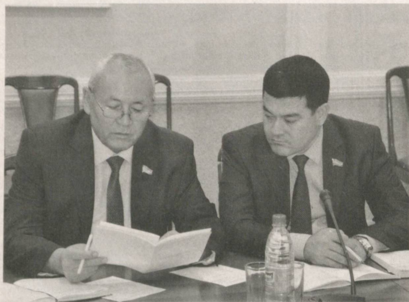
Фракция аъзолари қонун лойиҳаларини муҳокама қилишмоқда.