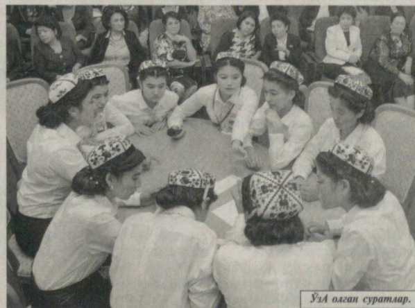
ЎЗА олдига суратлар.