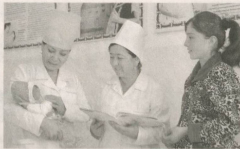
Сурхондарё вилояти Шеробод тумани тиббиёт бирлашмаси ҳамда кўп тармоқли туман марказий поликлиникаси янгидан қурилиб, фойдаланишга топширилди.

Тиббиёт бирлашмасида тўғруқ мажмуаси, хирургия, шошилч тез тиббий ёрдам, болалар, терапия, диагностика бўлимлари ва лаборатория мавжуд бўлиб, уларда ўттизга яқин малакали шифокор ҳамда 300 нафардан зиёд ўрта тиббиёт ходими хизмат кўрсатмоқда. Муассасанинг моддий-техник базаси мустаҳкамлангани самарасида ташхис қўйиш ва даволаш ишлари янада яхшиланди.