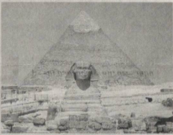
Интернет хабарлари асосида тайёрланди

Бир неча ой давом этган пардозлаш ишларидан сўнг ёдгорлик янгиланган киёфада намоён бўлди. Маълумотларга кўра, энди мазкур обидани яқиндан ҳам кўриш мумкин. Сфинкснинг реставрация ишлари одатда ҳар 8-10 йилда ўтказилади. Унинг илк таъмири эраминдан аввалги XIV асрга тўғри келади.