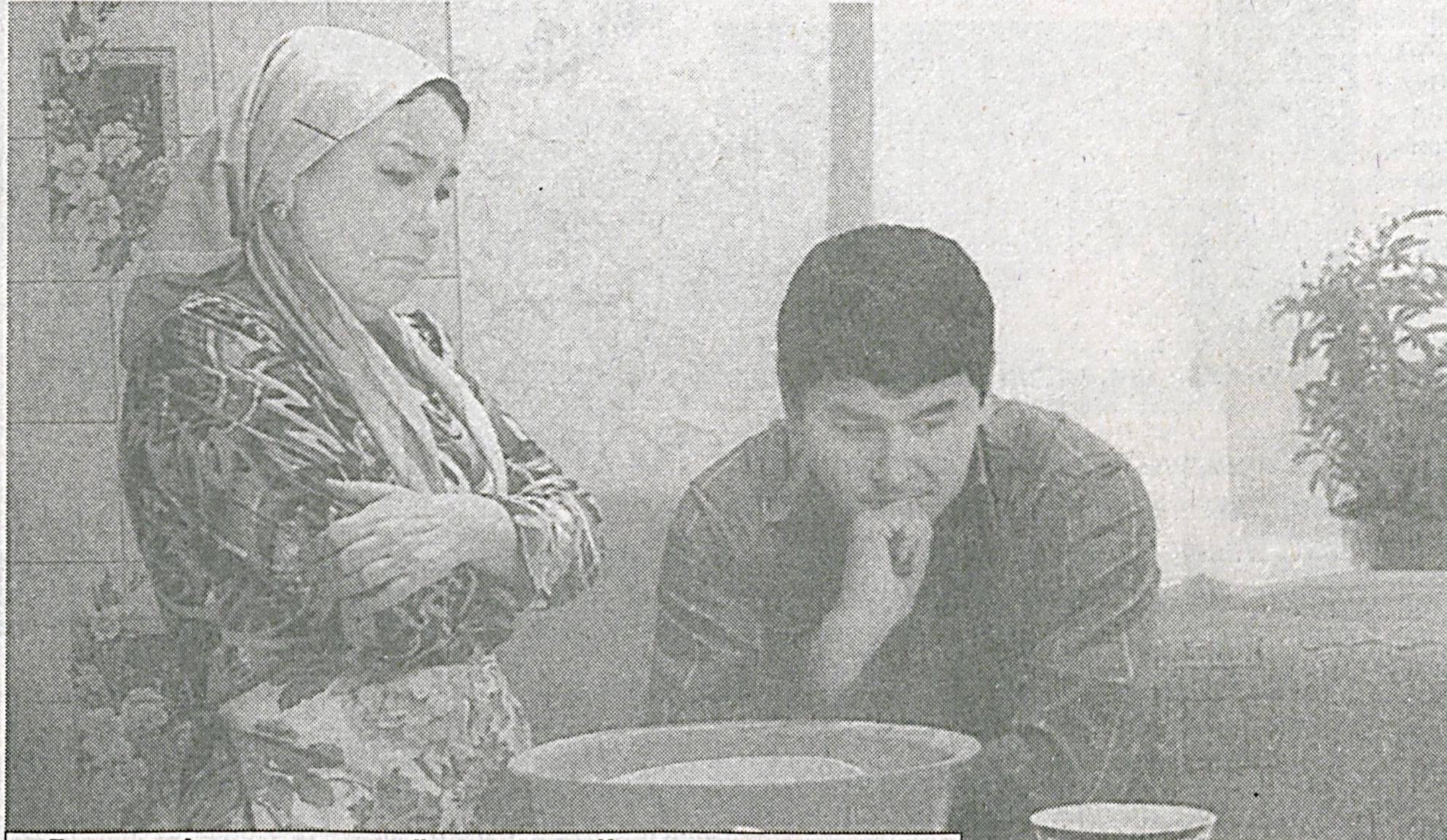
Баҳодир Аҳмедов режиссёрлигидаги «Қалдирғочлар яна қайтади» фильмидан лавҳа.

Унда бир европалик Тошкентга келиб, ўзбекларнинг бир тангасини олиб, эвазига «ойнаи ҳақон»идан яланғоч аёл суратини кўрсатади. Ҳозир ўша жанобнинг неваралари боболари касбини давом эттиришаётгандир эҳтимол. Бу ишни индустрияга айлантиришди. Унинг номини «оммавий маданият», яъни ҳамма кўриб, пул тўлайдиган, инстинкларни уйғотувчи, ҳаммабоп, ҳаммага тўшунарли маданият деб аташди.