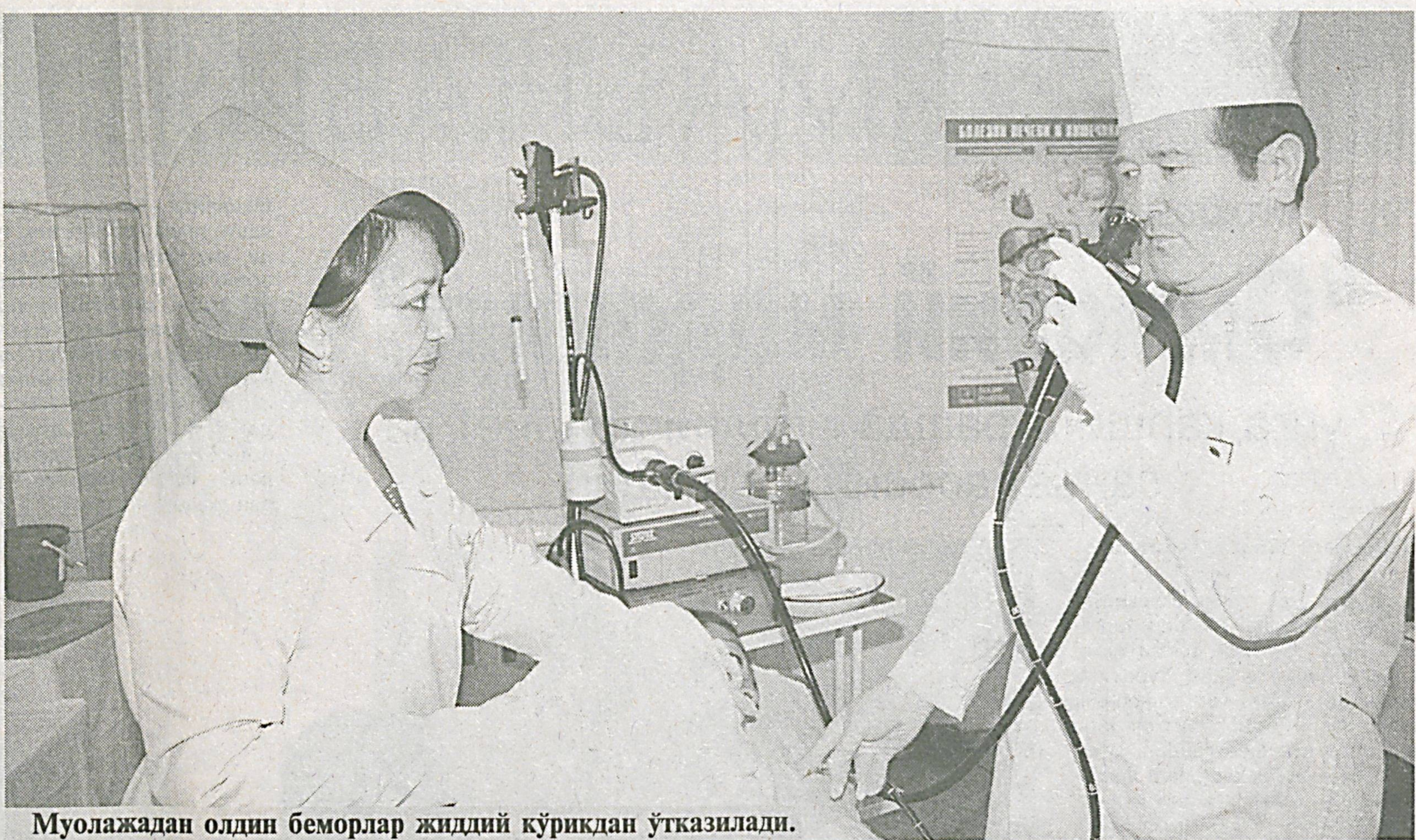
Муолажадан олдин беморлар жиддий кўриқдан ўтказилади.

Мамлакатимизда амалга оширилаётган суд-ҳуқуқ ислоҳотлари Инсон ҳуқуқлари Умумжаҳон декларацияси талабларига, ҳусусан, унинг 8-моддасида белгиланган "Ҳар бир инсон унга конституция ёки қонун орқали берилган асосий ҳуқуқлари бузилган ҳолларда нуфузли миллий судлар томонидан бу ҳуқуқларнинг самарали тикланиши ҳуқуқига эга", деган қоидага тўла мувофиқ келади.