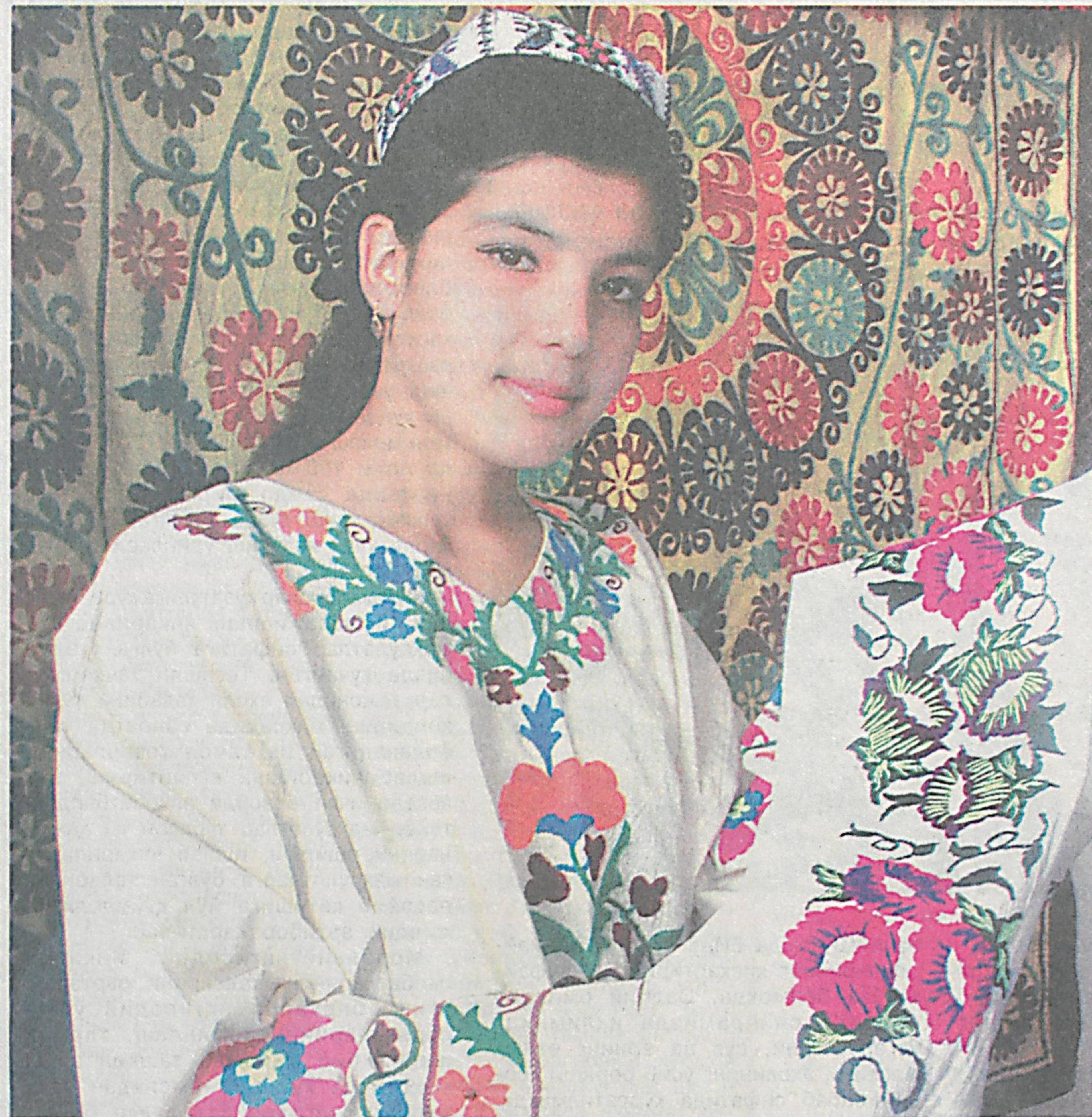
Каштачилик — авлоддан-авлодга ўтаётган бебаҳо мерос.

Халқимизда мард лафзи ҳалол, ориятли йигитларни “бе-лида белбоғи бор” дея макташади. Демак, белбоғ кишининг фазилатларини ҳам белгилган. Мен тадбиркор аёллар палатасига аъзо бўлиб, ишимни хунармандчиликдан бошла-ди. Қадимий либос ва буюм-ларимизни йиғиб, уларнинг