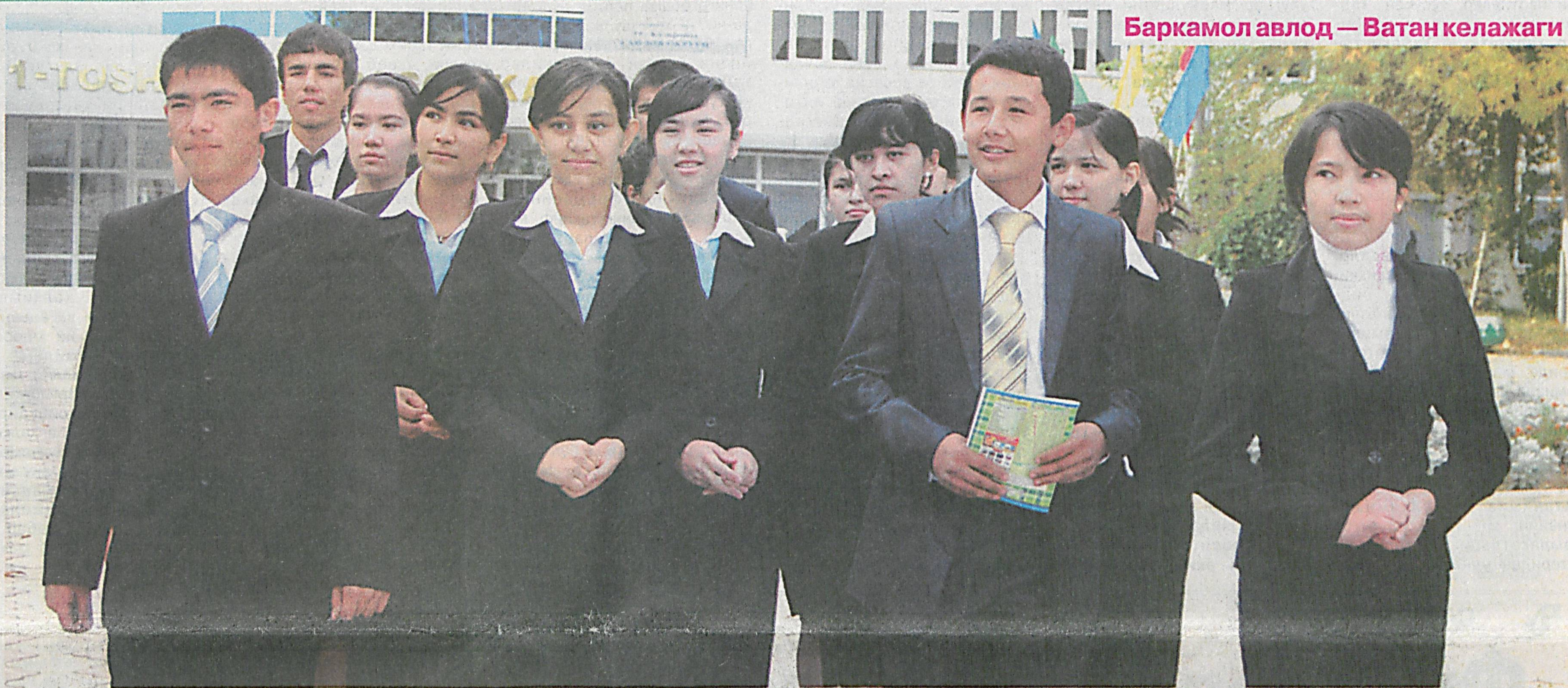
Баркамол авлод — Ватан келажаги