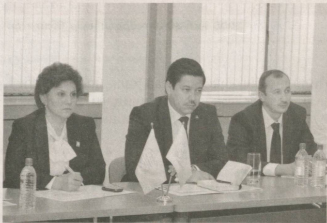
«Давоми. Бошланиши 1-бетда».

— Партиямиз Марказий кенгаши пленуми Ватанимиз мустақиллигининг 24 йиллик байрами арафасида, халқимиз энг улуг, энг азиз байрамни муносиб нишонлашга катта тайёргарлик кўраётган, шаҳар ва кишлоқларимизда беқабил бунёдкорлик ишлари амалга оширилаётган шухули кунларда ўтмоқда, — деди партия раҳбари. — Айниқса, Президентимизнинг «Ўзбекистон Республикаси давлат мустақиллигининг 24 йиллик байрамига тайёргарлик кўриш ва уни ўтказиш тўғрисида»ги қарори байрамни юксак даражада ва кенг нишонлашда муҳим асос бўлиб, барчамизга кўтаринки руҳ бағишлади. Қарорда белгиланган вазифаларни амалга оширишда Ўзбекистон «Миллий тикланиш» демократик партиясининг ҳам барча даражадаги ташкилотлари ва депутатлик бирлашмалари бор куч ва имкониятини ишга солимоқда. Партия Марказий кенгаши ва фракцияси истиклол байрамини муносиб нишонлашга доир чора-тадбирлар режасини ишлаб чиқди. Истиклол берган имкониятлар ҳақида гапирар эканмиз, тарихан қисқа муддат ичида мамлакатимизда Президентимиз раҳнамолигида асрларга татигулик ишлар амалга оширилганини гурур ва ифтихор билан тилга оламиз. Мустақиллик бизга, энг аввало, ўзлик, инсоний ҳақ-хуқуқ ва қадр-қимматимизни қайтариб берди. Мустақиллик йилларида юртимиз, шаҳар ва кишлоқларимиз қиёфаси тубдан ўзгариб, тобора оқиб ва гўзал бўлиб бораётгани, жумладан, кишлоқ жойларида ҳам намунавий уй-жойлар ва инфратузилма тармоқлари барпо этилаётгани ҳар бир инсон қалбига фахр