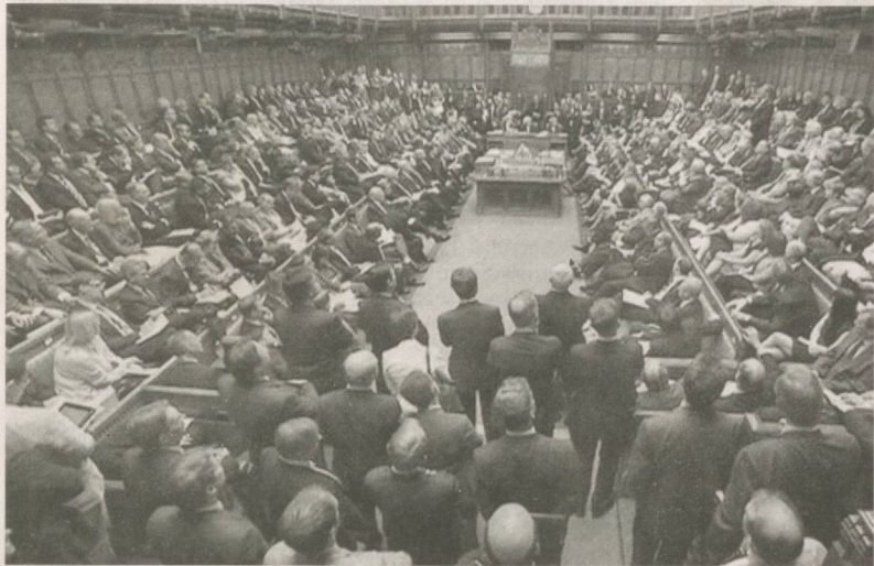
Буюк Британия ва Шимолий Ирландия Қўшма Қироллиги — шимолий-ғарбий Европадаги давлат. У қўшничка мамлакатнинг асосий қисмини ташкил этадиган Англия номи билан аталади. Майдони 244,1 миң квадрат километр, аҳолиси 58,5 миллиондан зиёд. Пойтахти — Лондон шаҳри. Тарихан таркиб топган ва миллий жиҳатдан ҳар хил бўлган 4 маъмурий сиёсий қисм — Англия, Уэльс, Шотландия ва унга ёндош оролар, Шимолий Ирландиядан иборат. Давлат бошлиги қирол (қиролича).

Мамлакатнинг конституцияси йўқ. 1215 йилги Буюк озодлик хартияси, 1679 йилги Хабеас корпус акти, 1931 йилги Вестминстер статута, 1969 йилги Халқ вакиллиги тўғрисидаги акт энг муҳим парламент ҳужжатлари ҳисобланади. Қонун чиқарувчи ҳокимиятни қирол (қиролича) ва парламент, ижро ҳокимиятини бош вазир бошчилигидаги ҳукумат (вазирлар маҳкамаси) бошқаради. Буюк Британия таркибидаги Англия, Уэльс ва Шотландия ўзининг суд тизимига, маҳаллий бошқарув органларига эга. Шимолий Ирландия маъмурий муҳторият ҳуқуқига эга бўлиб, уни қирол (қиролича) тайинлаган губернатор бошқаради.