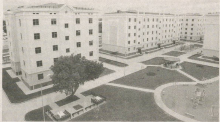
Давоми. Бошланиши 1-бетда.

Ўзбекистон Республикаси Президенти Ислон Каримов 25 август куни Тошкент шаҳрида амалга оширилаётган бунёдкорлик ишлари билан танишди