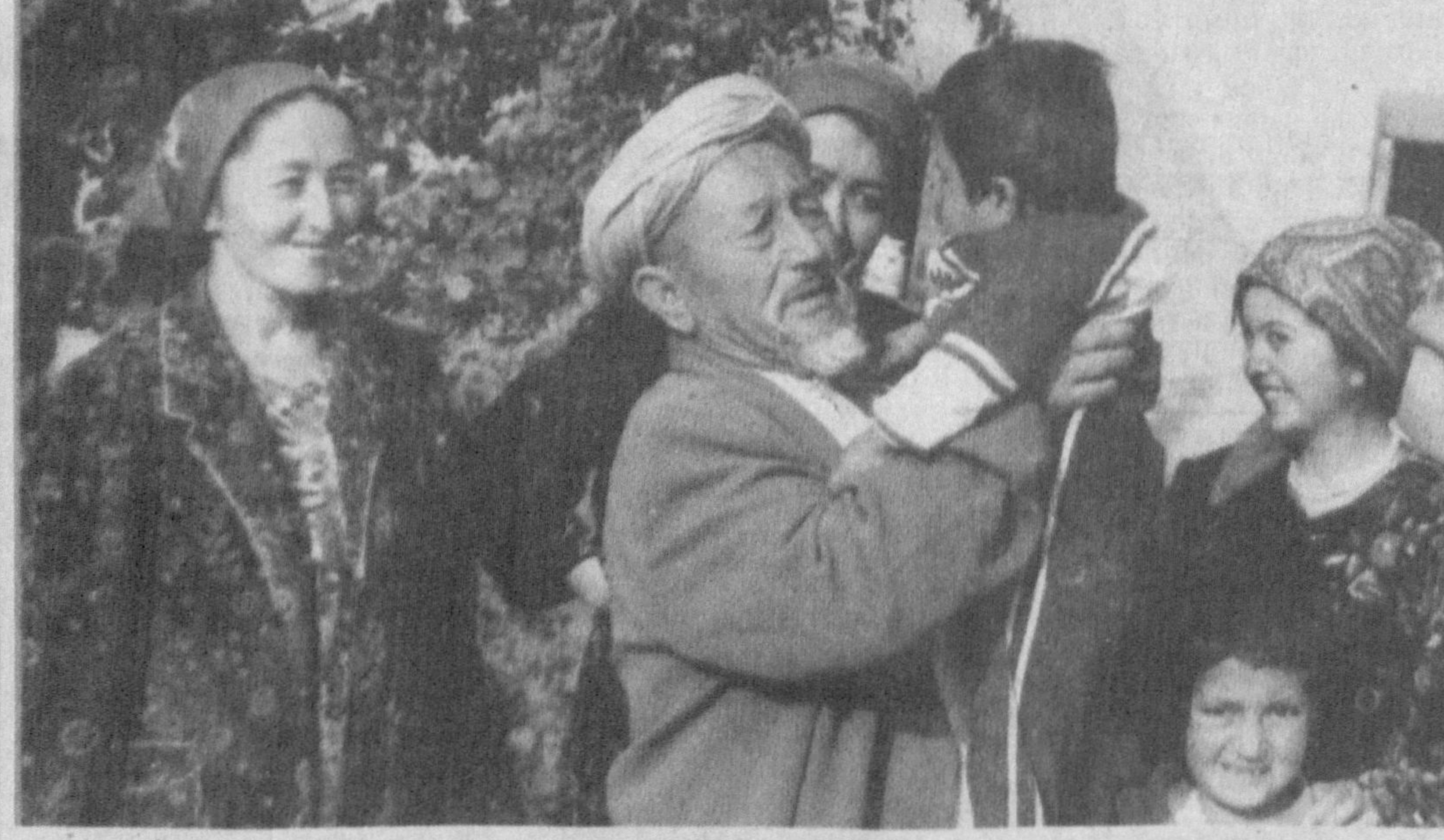
Фарзанд улғаяди, қалблар ёшаради