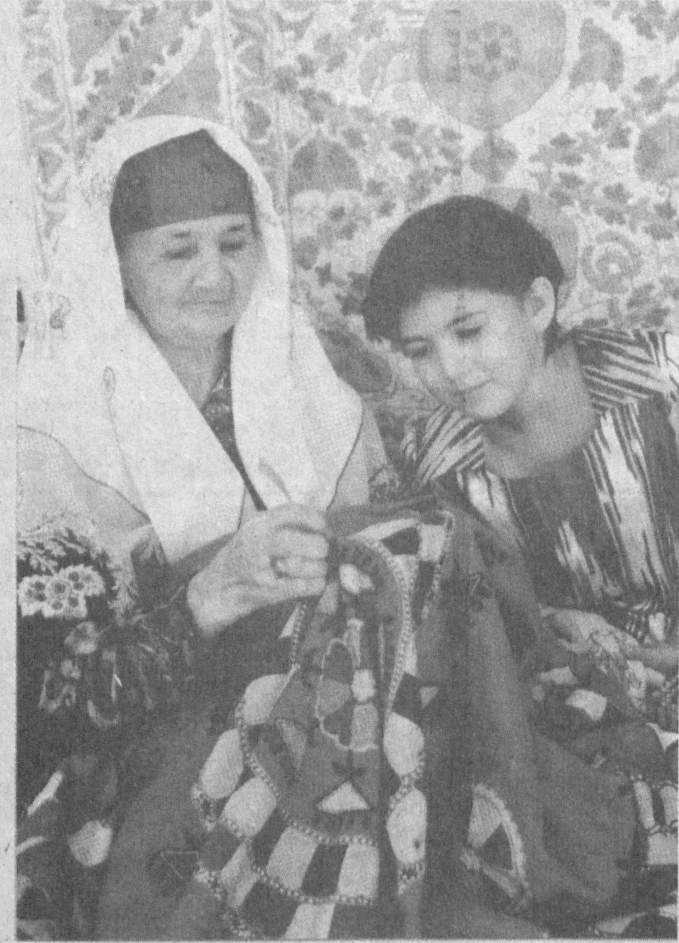
«Бу нақшларда минг йиллик тарихимиз бор, болам.»

Тошкентдаги «Чигатой» спорт мажмуасида дастлаб майдонга тушган Жиззах вилоятининг «Хайрабод» маҳалласи жамоаси ва Тошкент вилоятининг Чирчиқ шаҳридаги «Ишпоч» маҳалласи жамоалари республика босқичини бошлаб бердилар. Ҳисоб 4:0 бўлди ва «Ишпоч» дастлабки галабани қўлга киритди.