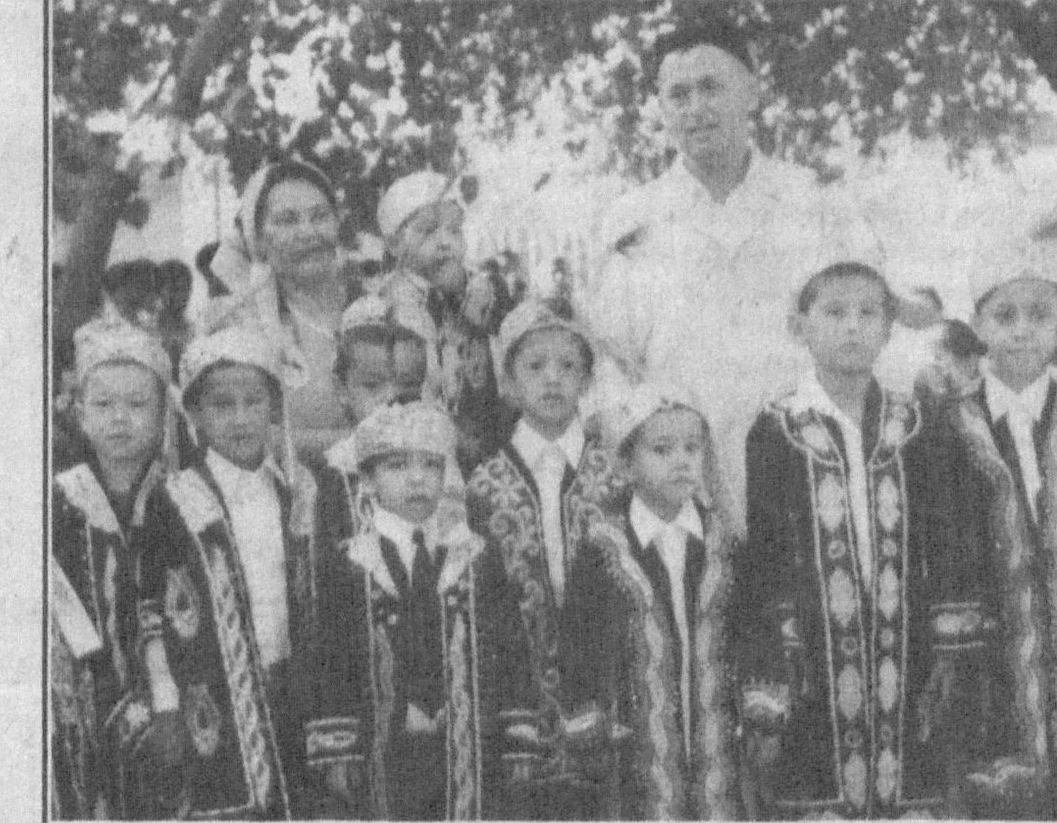
ТАНТАНАЛАР ТЎЙГА УЛАНДИ

Байрам барамга уланса қандай соз. Пойтахтнинг Шайхонтохур тумани Шоймол Шобулов номи маҳалла ҳам шундай бўлди. Мустақилликнинг 9 йиллиги муносабати билан ўтказилган тантаная маҳаллага кам таъминланган оилалардан ўн нафар ўг-лоннинг хатна тўйига уланиб кетди. Маҳалла фуқаролар йиғини ташаббуси билан илк бор мактаб остонасига қадм қўётган ўг-ити нафар ўғил-қизга мактаб либослари ҳая этилди.