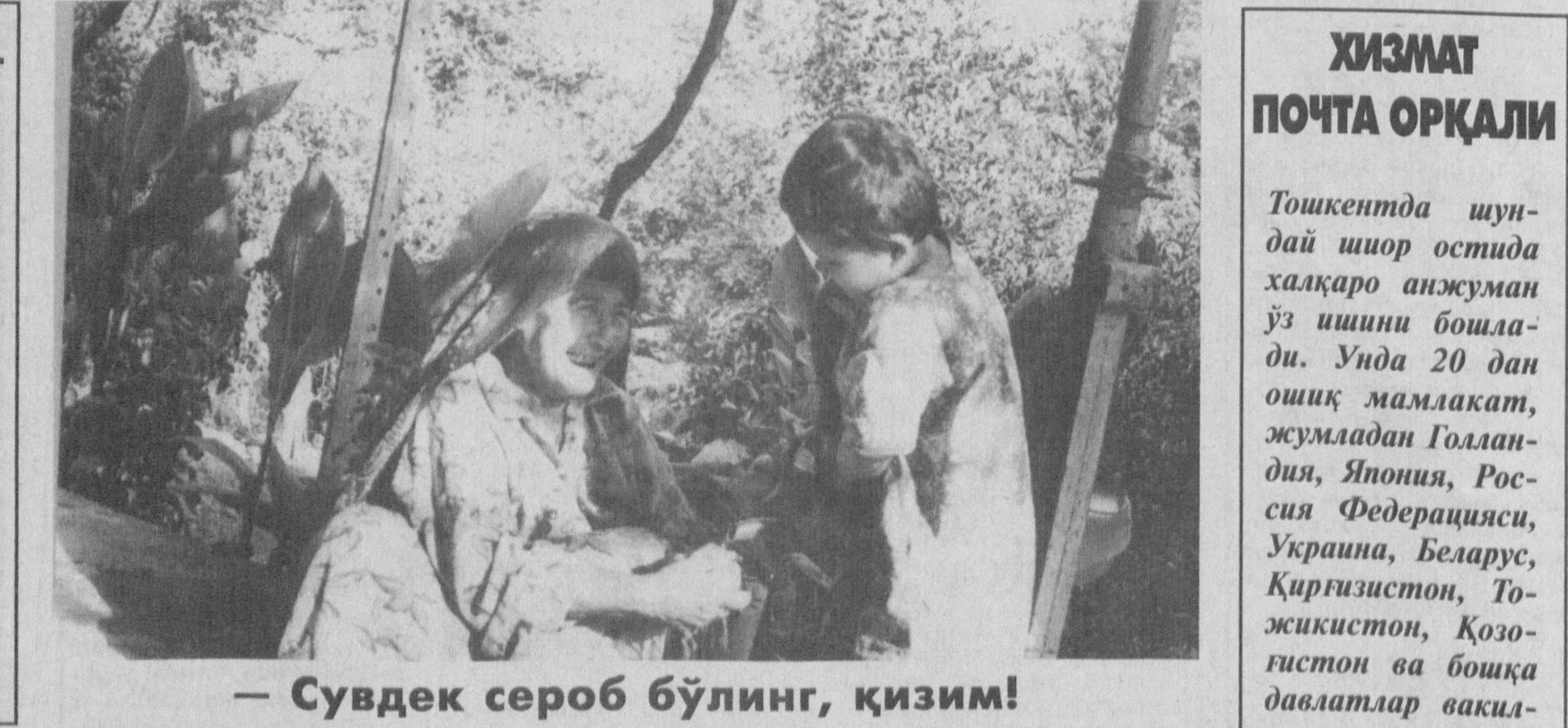
— Судек сероб бўлинг, қизим!

ри овул жойларида фаолият кўрсатувчи «Ота макон» жамғармасига фақат хорижий эмас, балки Қорақалпоғистондаги ҳо-қимликлар, давлат ташкилотлари ҳам амалий кўмак берадлар дуруст бўлар эди. Чунки экологик офат зонасидаги мушкул вазиятда истиқомат қилувчи аҳолининг яшаш ва ишлаш шароитини яхшилаш ҳаммамизнинг муқаддас бурчимиз ҳисобланади. Асилбек ИСКАНДАРОВ, «Mahalla» муҳбири.