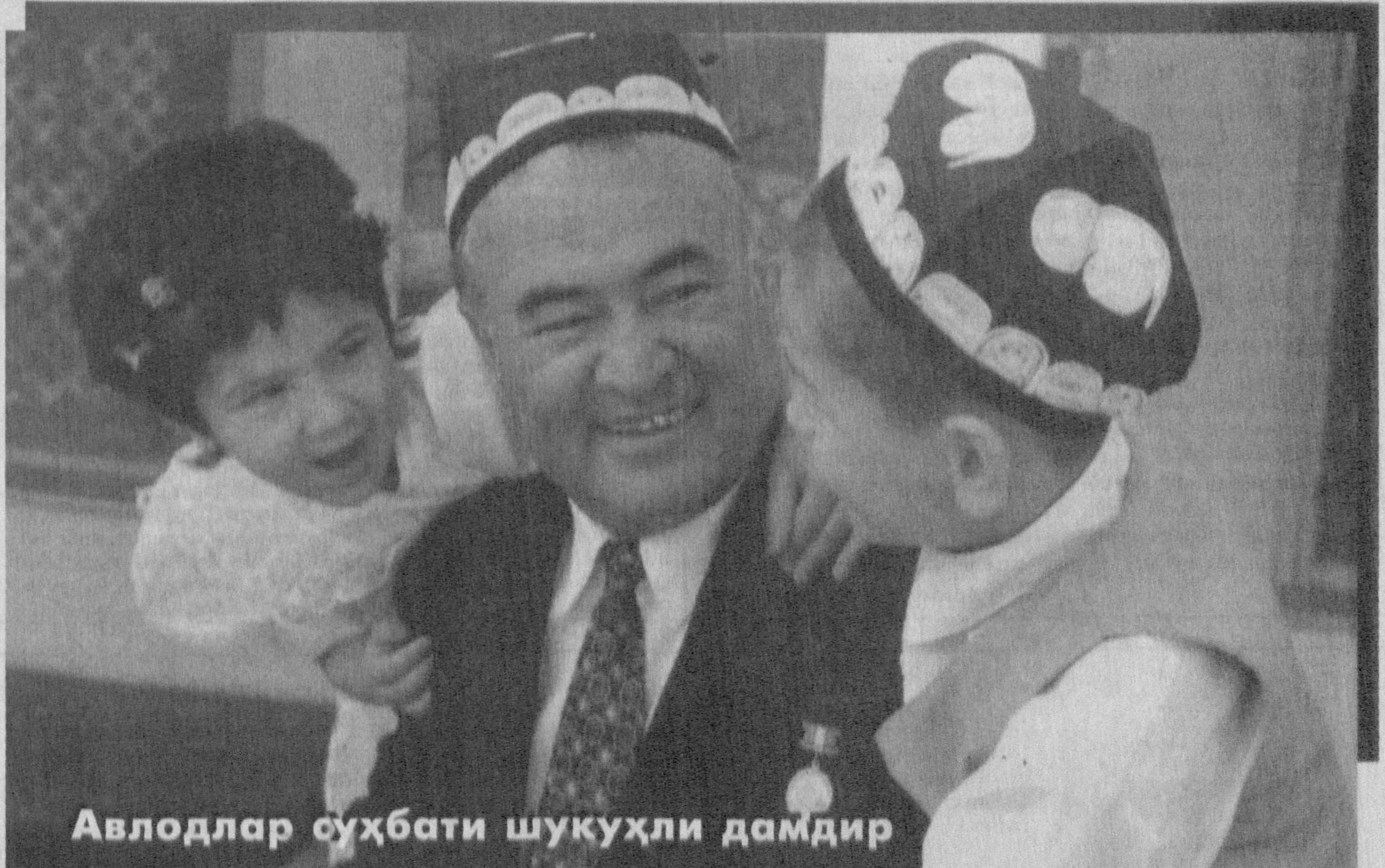
Авлодлар суҳбати шуқуҳли дамдир