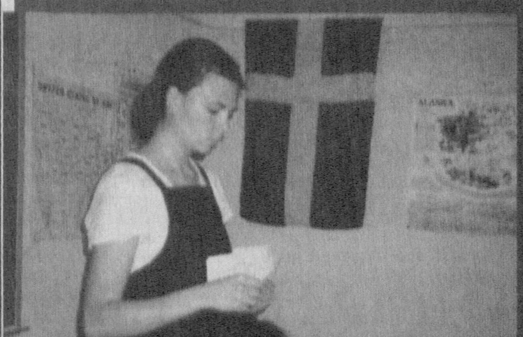
Суратларда: Чет эллик меҳмонлар (чапда) ва Корақаллогистон Республикаси Жўқорги Кенгеси қўмитаси раиси Жанабой Содиков болаларга совға улашмоқда.