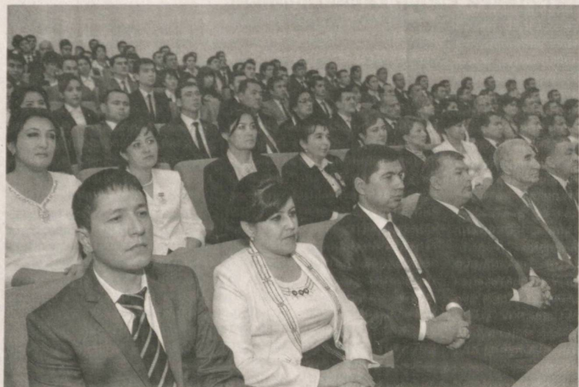
«Давоми. Бошланиши 1-бетда.

Ушбу тарихий санани байрам қилар эканмиз, мустақиллигимизнинг мустаҳкамланиши, ижтимоий-иқтисодий соҳаларнинг изчил ривожланиши, аҳоли турмуш дара-