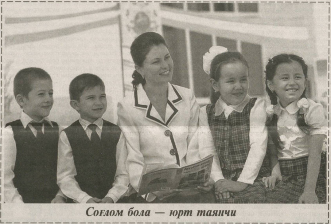
Соғлом бола — юрт таянчи