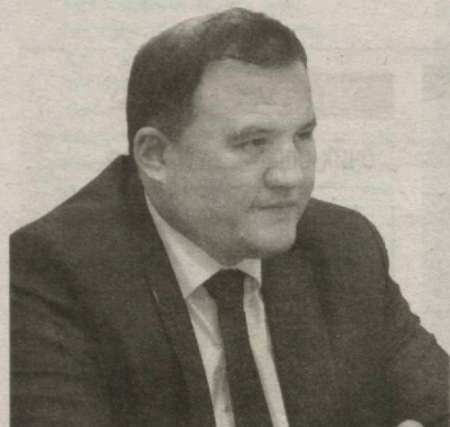
Актам ХАЙТОВ, Олий Мажлис Қонунчилик палатаси Спикери ўринбосари, O'zLiDeP фракцияси раҳбари

Мамлакатимизда тадбиркорликни ривожлантиришга қаратилаётган катта эътибор, бизнес субъектларига берилётган имтиёз ва энгилликлар сабабли бу тармоқ ўзининг иқтисодий тизимдаги ўта муҳим ва салмоқли ҳиссаси билан давлатимиз ва жамиятимиз тараққиётида тобора муҳим ўрин эгалламоқда. Ушбу соҳада ҳаётга татбиқ этилаётган ислохотлар натижасида минглаб оилаларга барака киряпти, юз минглаб янги иш ўринлари яратилляпти.