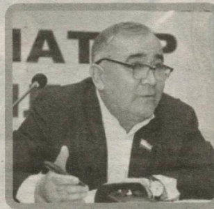
Абдуғани САНГИНОВ, Олий Мажлис Сенати аъзоси

Хулоса шуки, ҳар бир оиланинг бизнес билан шуғулланиши ва барқарор даромад манбаига эга бўлиши учун O'zLiDeP ва унинг парламентдаги фракцияси бор куч ва салоҳиятини сафарбар қилади. Жойларда тадбиркорлар билан очиқ мулоқотни йўлга қўйган ҳолда, уларни қийнаётган масалаларни ҳал этади, уларга яқин дўст бўлиб, бизнес вакиллари билан елкама-елка ишлайди. Зотан, иқтисодий тараққиётни тадбиркорларнинг фаолиятисиз тасаввур этиб бўлмайди.