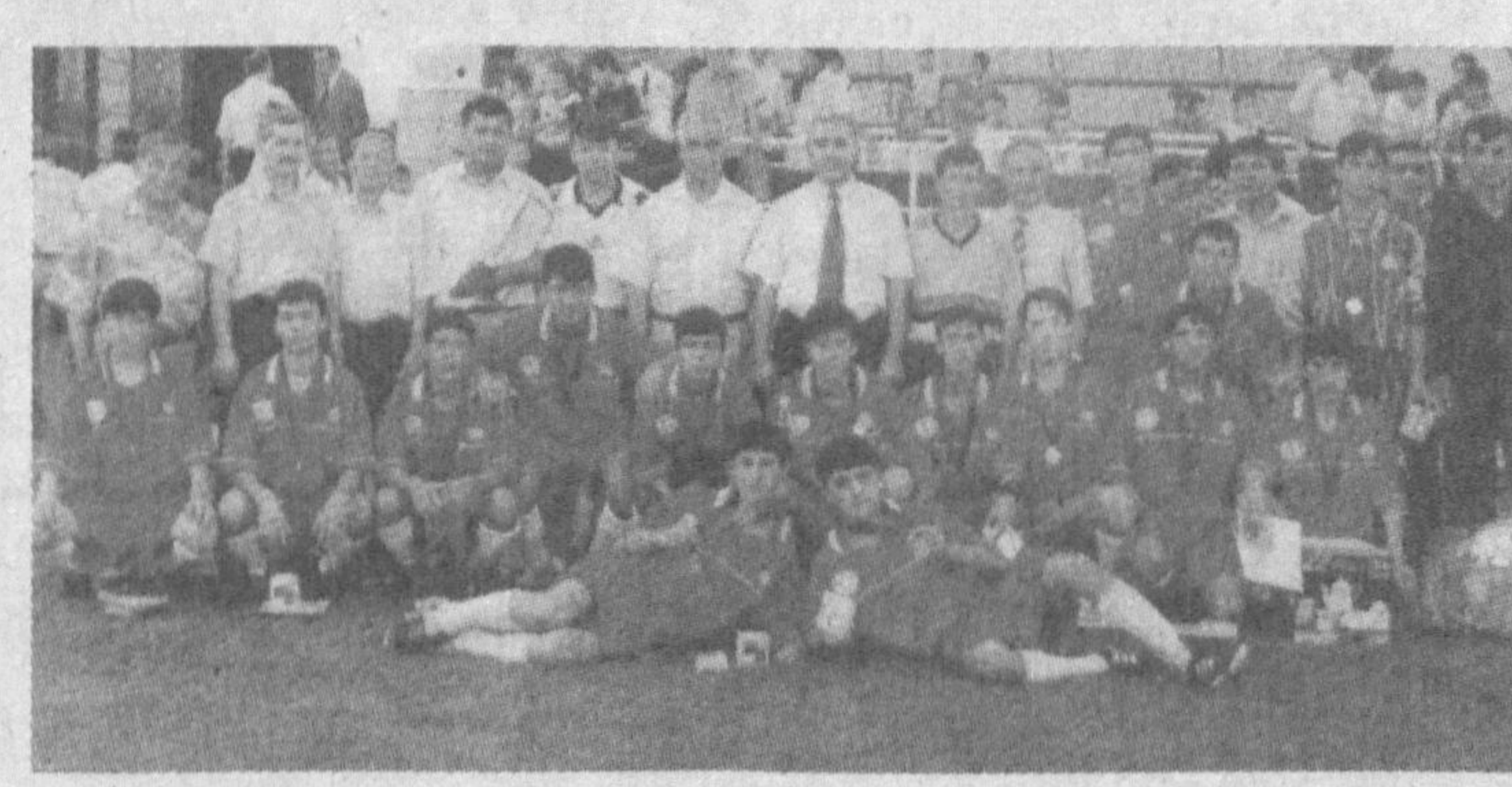
Наманганнинг Ҳақиқат жамоаси иккинчи ўрин соҳиби бўлди.

Бугунги кунда Ҳамза тумани А.Назаров номи маҳалла оқсоқоли Собир ҳожи Комилонни нафақат пойтахтимизда балки республикамизда ҳам кўпмак маҳалла мутасаддилари яхши танийдиган бўлиб қолди. Газетамизда бу оқсоқолнинг маҳалла, маҳалладошлари ҳаёти фаровонлиги учун қилаётган баракали ва самарали харакаatlари ҳақида жуда кўп ёзилди. Ўтган йили оқсоқол Ўзбекистон Оқсоқол-