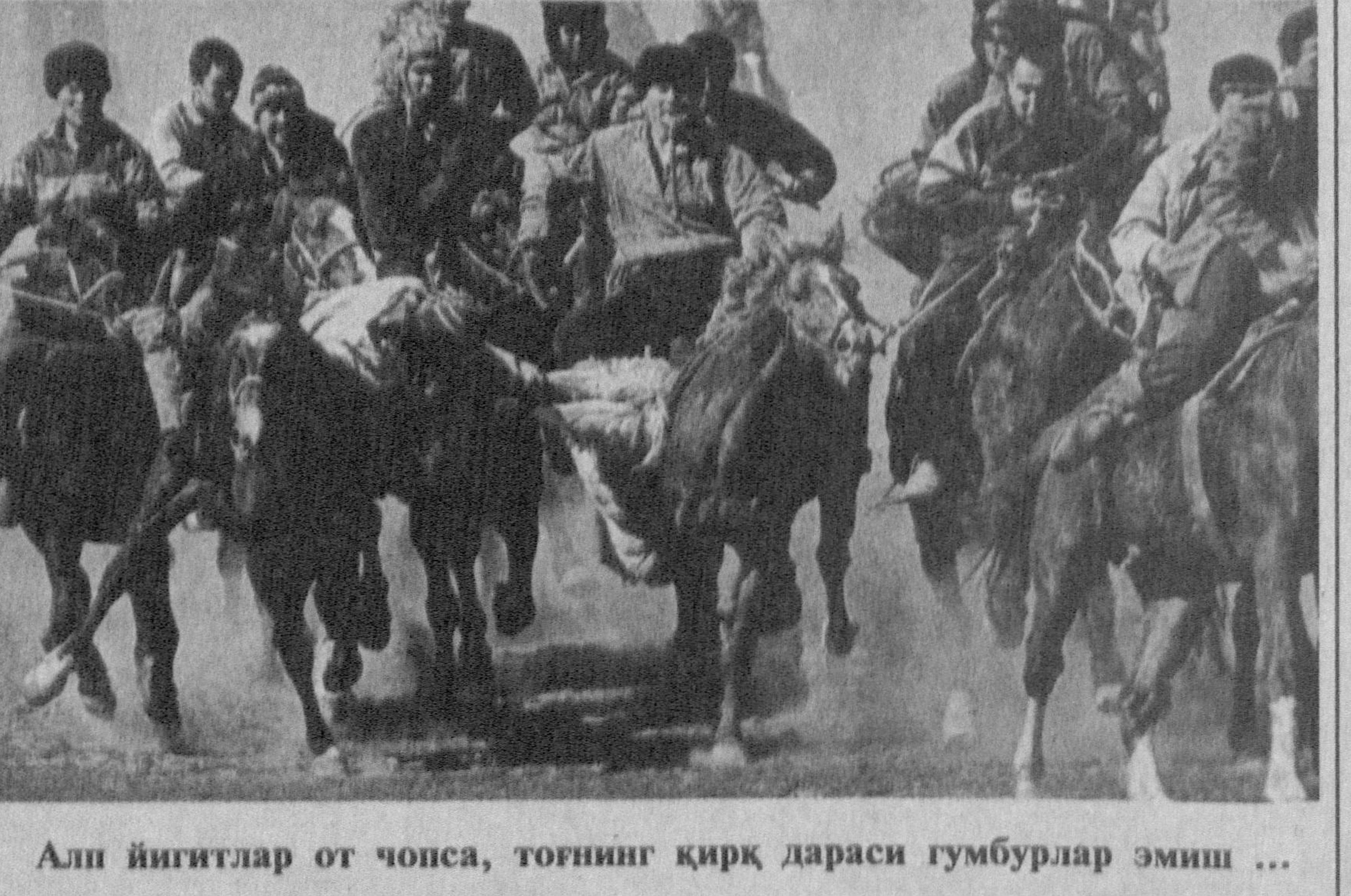
Алп йигитлар от чонса, тоғнинг қирқ дараси гўмбурлар эмиш ...

Файли маҳалла идораси оз бўлса-да таъмирланиб, аниқгина қулайликлар юзага келди. Ҳар ҳолда маҳалла кексалари узун-узун ёғочларга шолча тушаб эмас, кроватда, ёки замонавий стол-стулларда ўтириб чой ичишмокда.