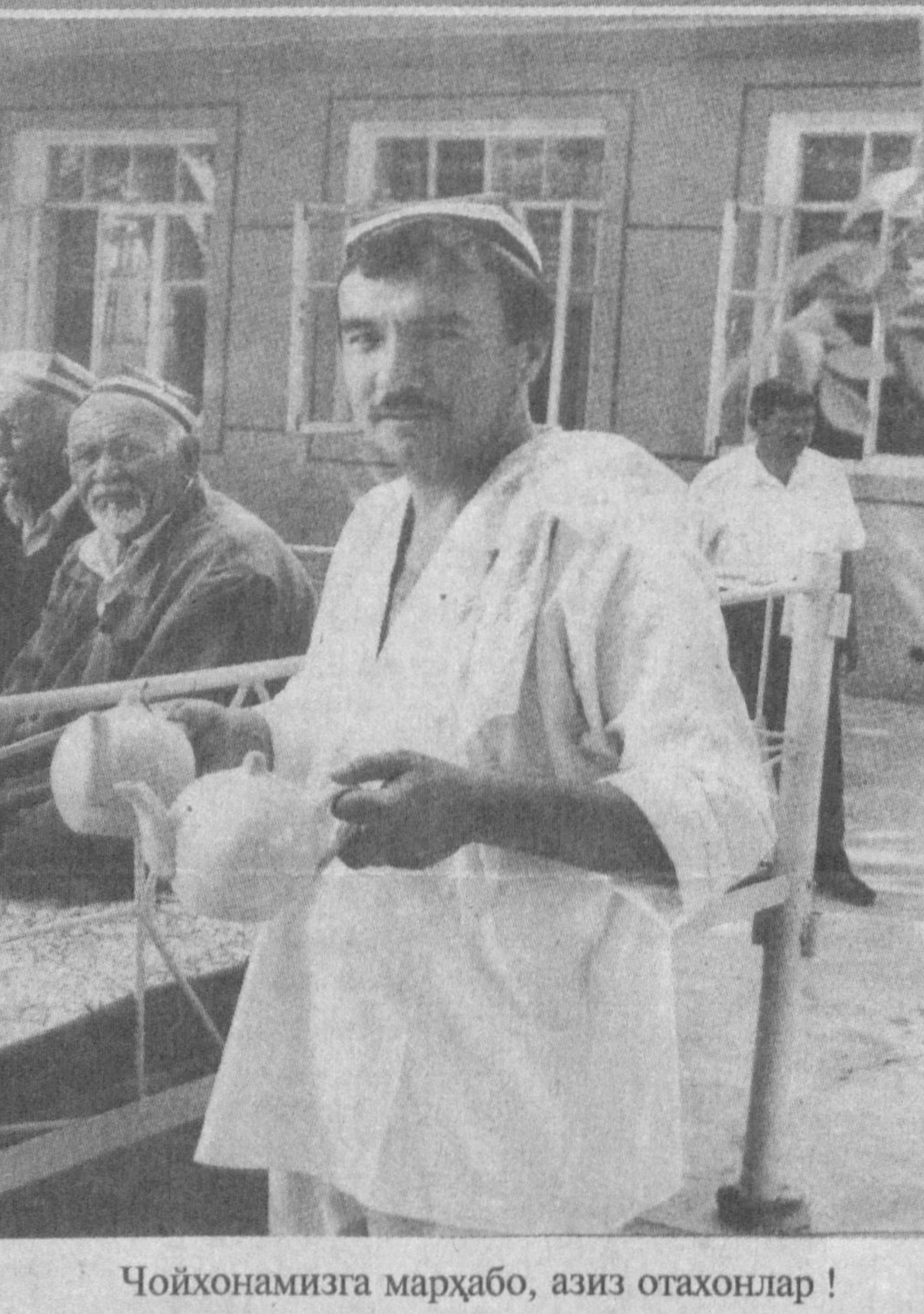
Чойхонамизга мархабо, азиз отахонлар!

«Қишлоқ ва маҳалла оқсоқолларининг энг муҳим вазифаси аввало, юртпарвар, эдиллик ва аҳиллик бўлиб, «Умуманфатини уйлаш лозим, улар тадбиркорлик, ишчилик, қолверса, маҳалланинг ҳар бир ишчиси учун гам-хўрлик - уларнинг одамийлик жоғдаларини тўлириди, деб билман. Туман ҳокимлиги қишлоқ ва маҳалла оқсоқолларида ана шу хислатларни қарор топтириш учун ташкили, тарбиявий ишларни амалга оширмакда.