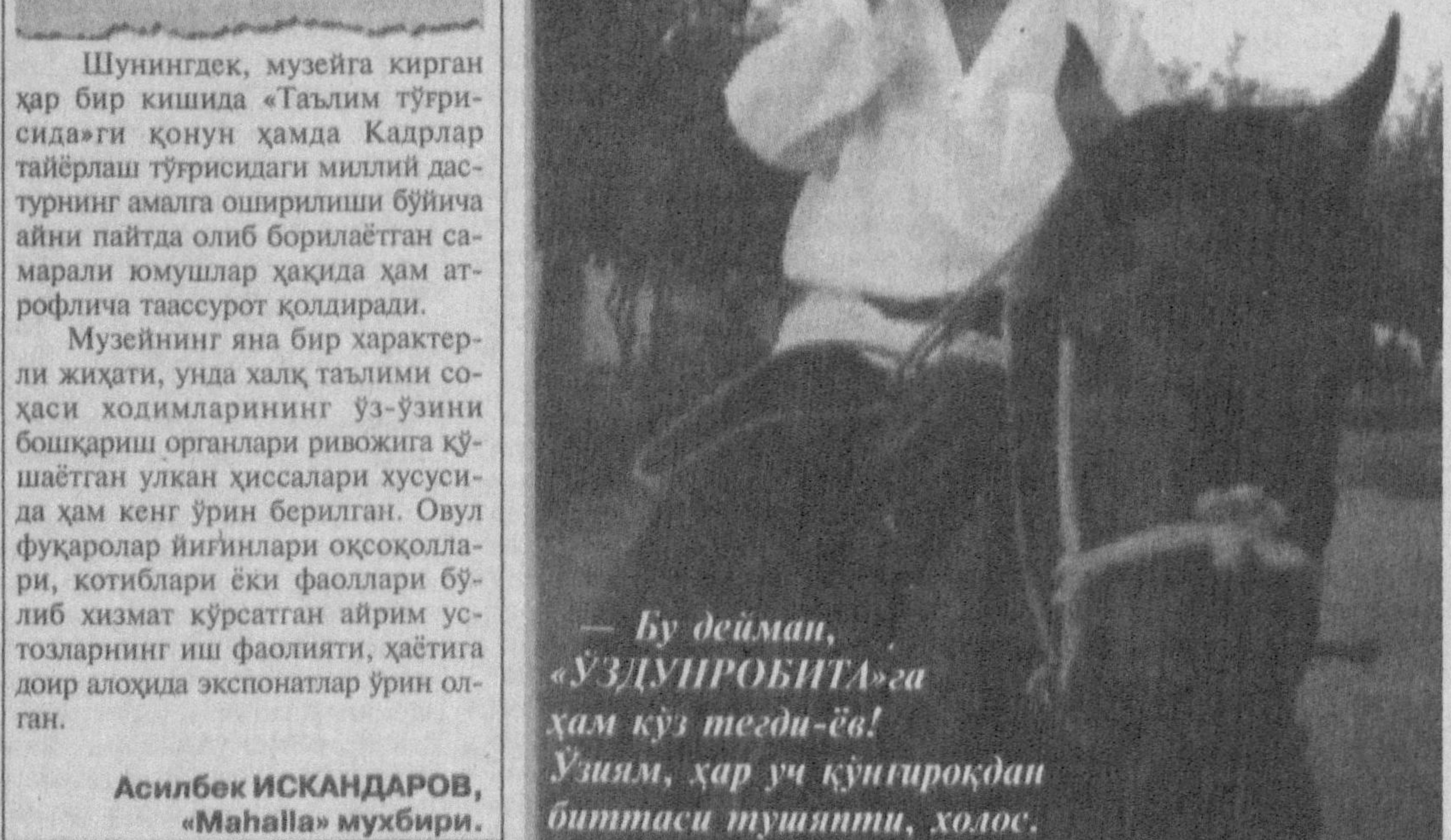
Бу дейман, «ЎЗДИРОБИГА» га ҳам кўз тедади-ё! Ушунга, ҳар уч кўнғироқдан биттаси тушганини, ҳолоқ.

Келгил туманида янги музей иш бошлади. Унга қўйилган 400 га яқин экспонатлар туманда халқ таълими ривожини, таълим-тарбиянинг юқори савияда ташқи этилиши ҳақида эксонбозлик кўрсатган устозлар тўғрисида ҳақоқ қилади.