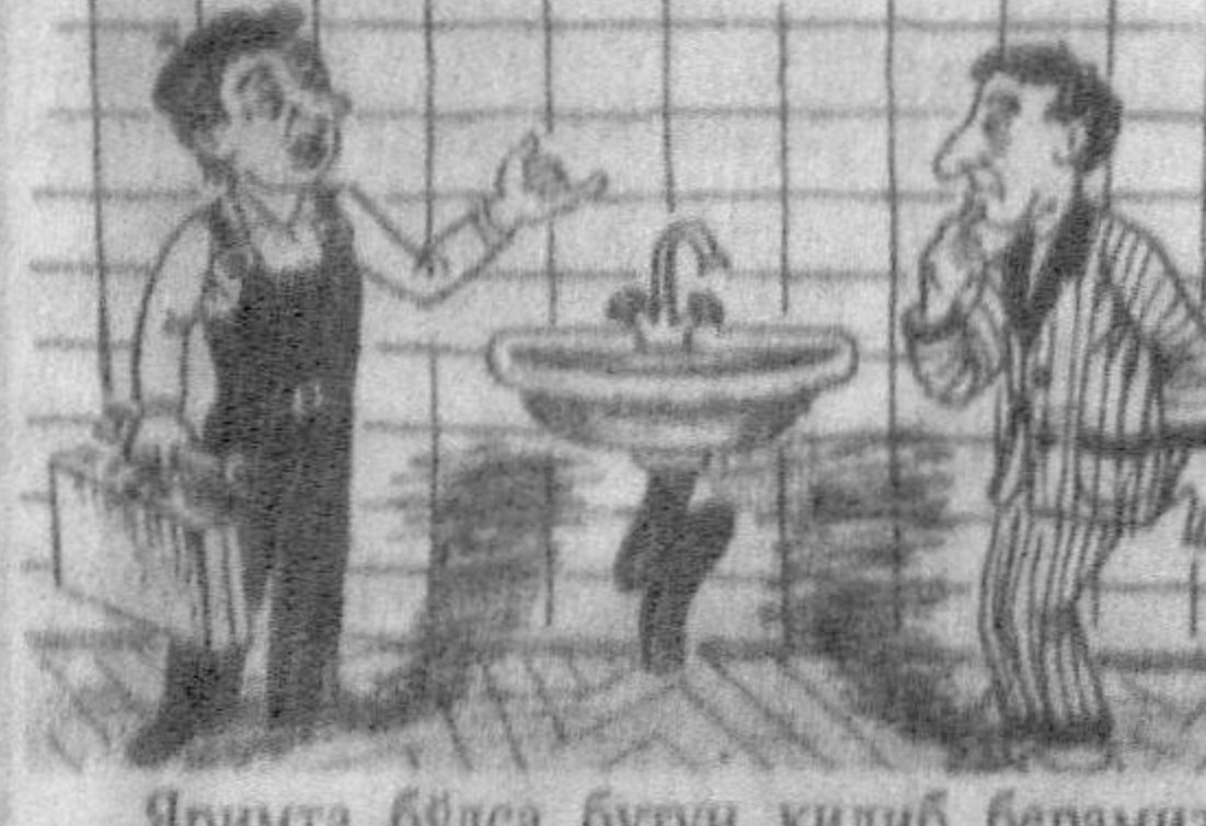
Яримта бўлса бутун қилиб берамиз.