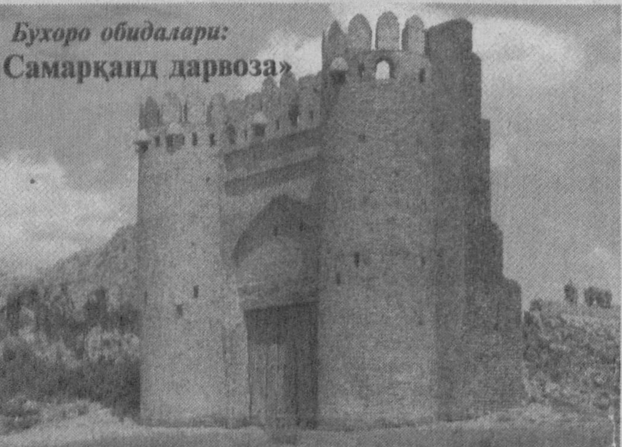
Бухоро обидалари: «Самарқанд дарвоза»