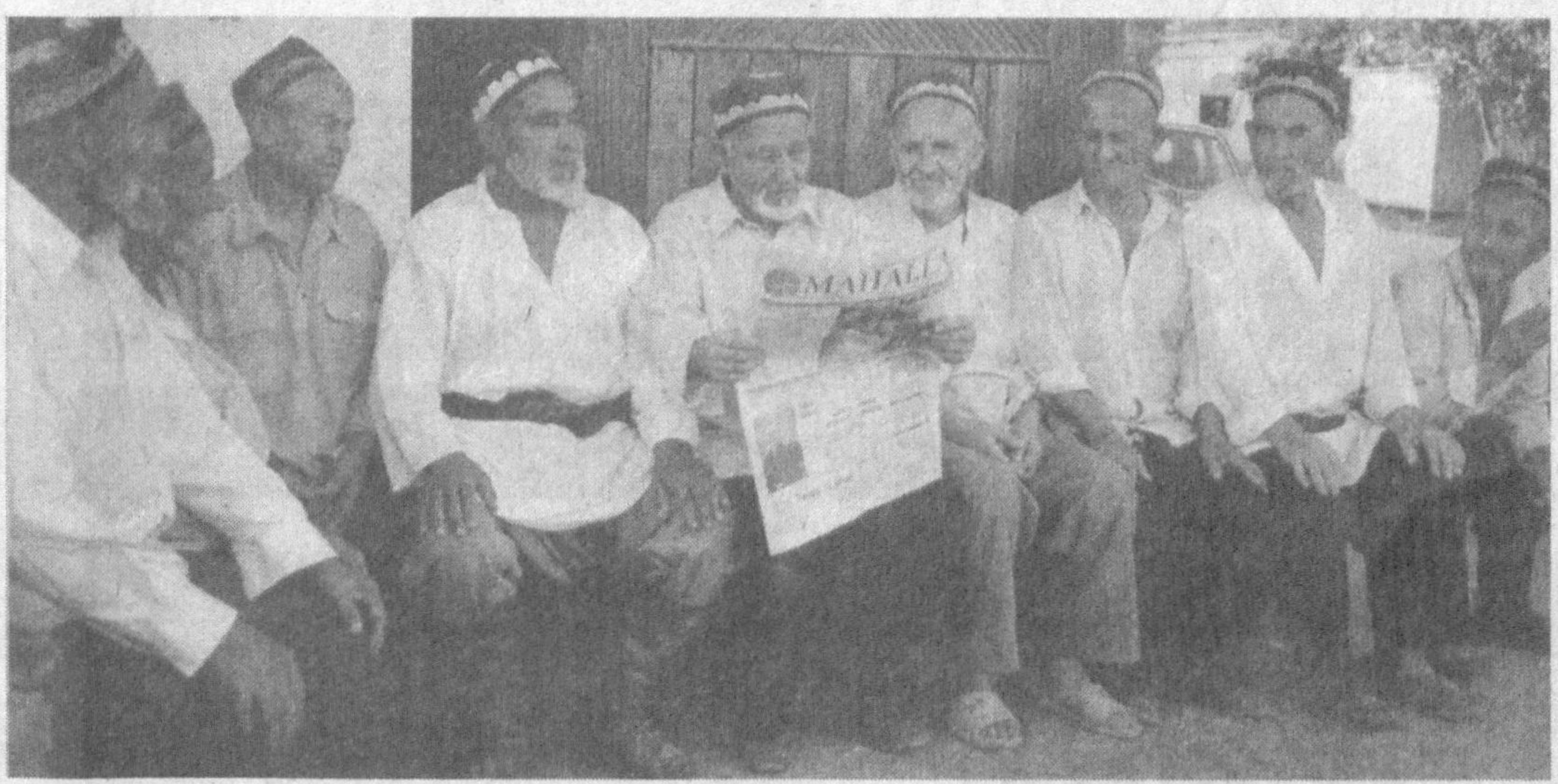
Тўққиз одамга бир «Mahalla». Бу озми ёки кўпми? Энди, ҳар кимнинг ўз «Mahalla»си бўлганига нима етсин.