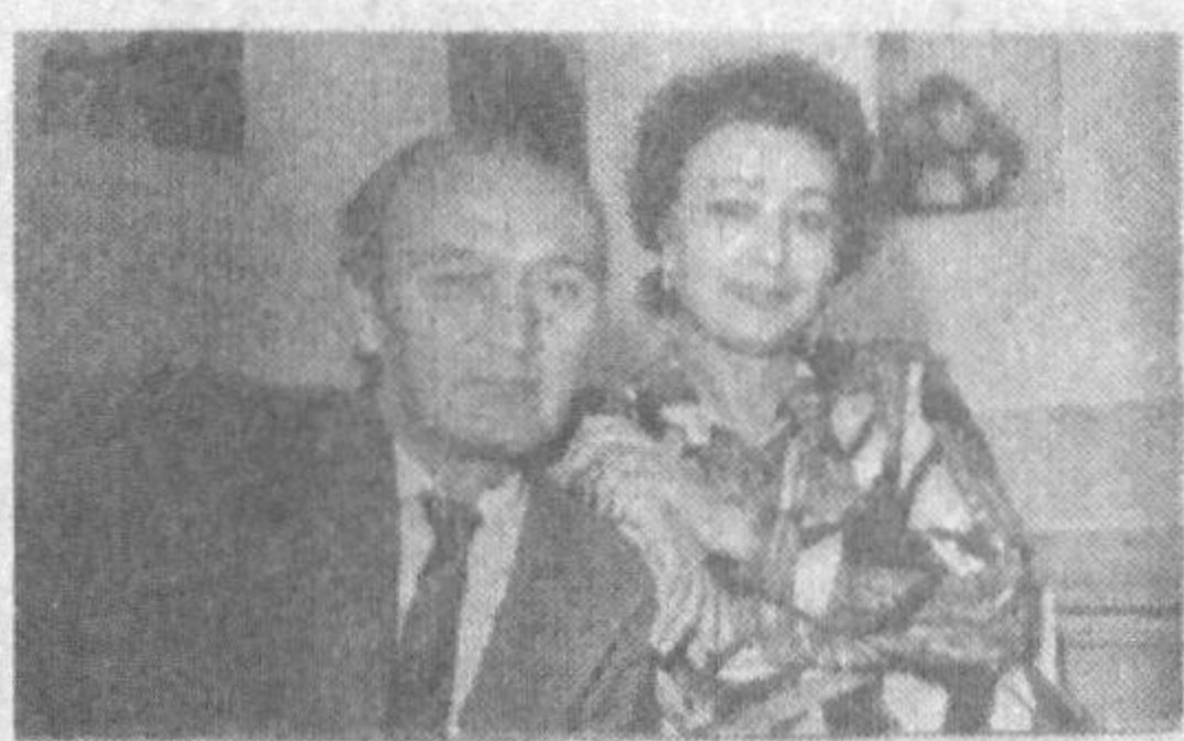
Мели МАҲКАМОВ, Тамара МАҲКАМОВА:

Тамара она ва Мели Маҳкамолар оиласига кўпчилик ҳавас қилса, эҳтимола. Ҳар икковлари ҳам Ўзбекистон телевидениесида қарийб қирқ йилдан буйи фаолият кўрсатишади. Уларни деярли бутун мамлакат ахли танийди. Ҳар икковлари ҳам кўп йиллик ижодлари довомида миллий, ўзимизга хос ва мос асарлар яратиб халқимиз меҳрини қозonganлар.