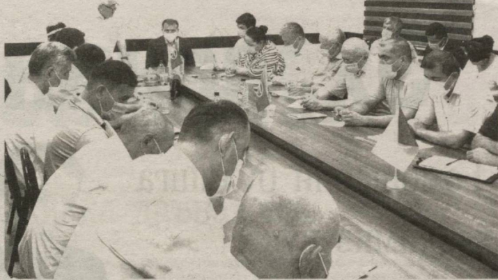
– Аввалданоқ айтиб кўяй: бу ўзгариш ҳақида кеча ёки бир ой аввал

Яна бир эътиборли жиҳати, парламентдаги партия фракцияси орқали ислохотларнинг қонунчилик асосларини такомиллаштириш борасида ҳам мутлақо ўзгача ёндашувлар жорий