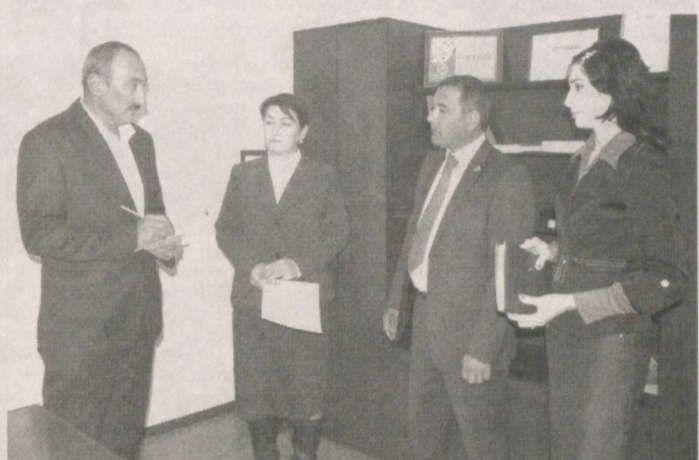
ШҚда рўйхатдан ўтган партия ташкилоти «Тадбиркорлар ва мулкдорлар синфига бегараз ёрдам кўрсатаётган, касаначилик ва оилавий тадбиркорликни йўлга қўйишда фаол иштирок этган БПТ» ва яна 7 та қуйи бўғин шу сингари номинатсиялар бўйича муваффақият қозониб, навбатдаги босқичда қатнашиш ҳуқуқини кўлга киритдилар.

олиб борилаётган ободонлаштириш, кўкаламзорлаштириш, маънавий-маърифий ишларда ҳам партия ташкилотимиз бошқош. Тез-тез ташкил этилаётган давра суҳбатларида минглаб ёшлар қатнашишяпти. Фаолларимиз Ҳузур, Деҳқонбод туманларида бўлиб ўтаётган партиявий тадбирларда сўзга чиқиб, тадбиркорликни ривожлантириш, одамларнинг интеллектуал қобилиятини ишга солиш, туманларнинг ички имкониятларидан самарали фойдаланиш борасида асосли таклифлар билдирмоқдалар. Вилоятдаги бошланғич ташкилотлар ўртасида биринчи бўлиш шарафли, айни пайтда зиммамизга катта маъсулият ҳам юклайди. Давр билан ҳамқадам ва ҳамнафас иш юритиб, партияимиз нуфузини оширишга бундан-да кўпроқ ҳисса қўшишга бел боғлади. Ҳакамлар ҳайъати аъзоси Панжи Гелдиевнинг айтишича, «Яккабоғ геофизика экспедицияси» филиалида фаолият юритаётган таянч бўғин «Энг кўп аъзоларни бирлаштирган БПТ», «Арабхона» МФЙ бошланғич ташкилоти «Хужжатлар юритилиши яхши йўлга қўйилган, энг яхши хона ва жиҳозларга эга бўлган БПТ», «Қашқадарёмаҳсуқурилиш»