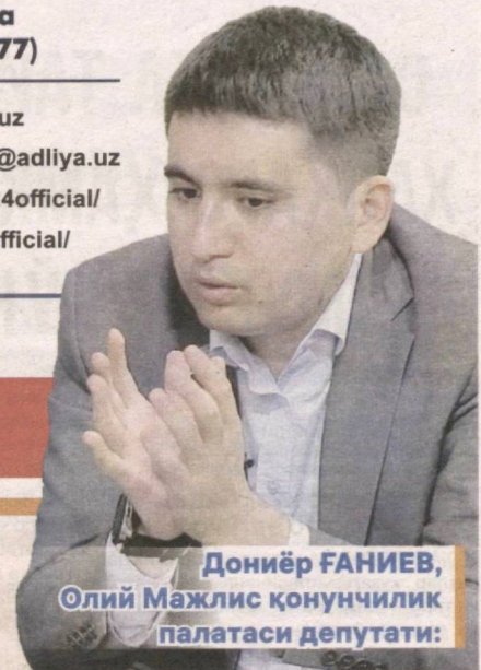
Дониёр ҒАНИЕВ, Олий Мажлис қонунчилик палатаси депутати:

www.hudud24.uz insonvaqonun@adliya.uz fb.com/hudud24official/ t.me/hudud24official/