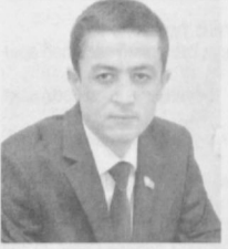
Ўткир ТУРСУНОВ, Олий Мажлис Қонунчилик палатасидаги, О'зЛиДеР фракцияси аъзоси

Ҳақиқатан ҳам шундай. Тинчлик туфайли эмин-эркин яшаб умргузорлик қилиш, озодлик ва эркинлик каби муқаддас тушунчаларни юракдан ҳис этиб яшаш мумкин.