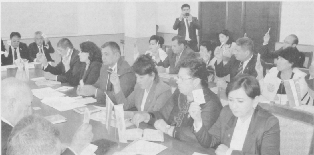
САФДОШЛАРИМИЗ ОЛДИДАГИ ДОЛЗАРБ ВАЗИФАЛАР

масъулият ва ишонч фаолият мезонини белгилайди