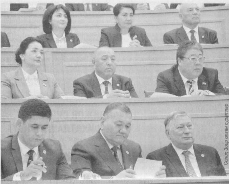
Салих Зоир олган суратлар

Шунинг учун ҳам барча сафдошларимизни партиямиздан кўрсатилган номзодни яқдиллик билан қўллаб-қувватлашга чақираман ва буни бугунги куннинг энг тўғри қарори деб биламан.